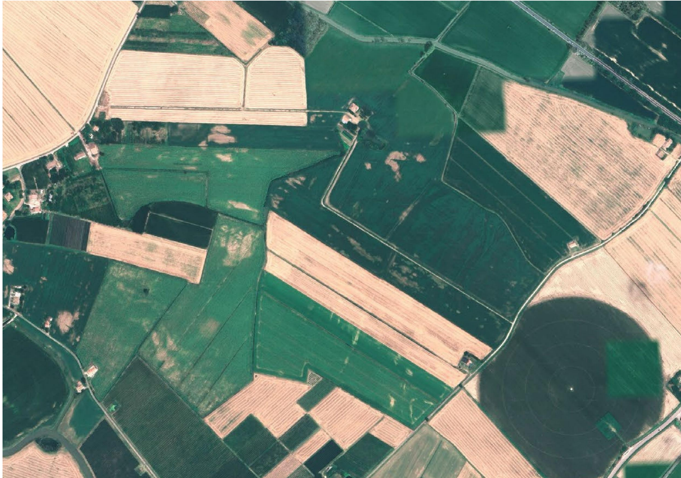
Figura 1. Situazione Ante Operam - Ortofotocarta dell'area selezionata, per la realizzazione dell'impianto agrivoltaico avanzato "Portomaggiore-Fossa".