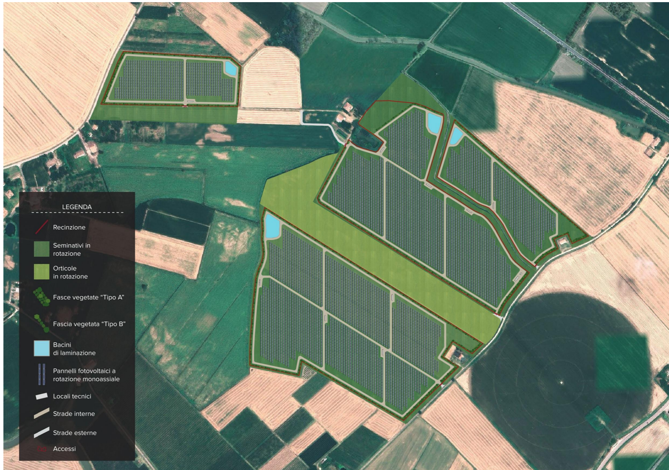
Figura 2. Situazione Post Operam – Rappresentazione su Ortofotocarta del Layout di progetto, con rappresentazione grafica della componente ambientale (attività agricole, fasce arboreo-arbustive, etc.) e della componente tecnologica (pannelli fotovoltaici, strade e locali tecnici).