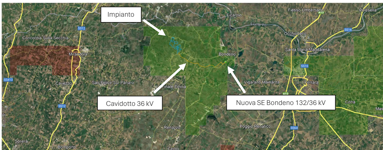
Figura 2: WebGIS UNMIG - Ferrara