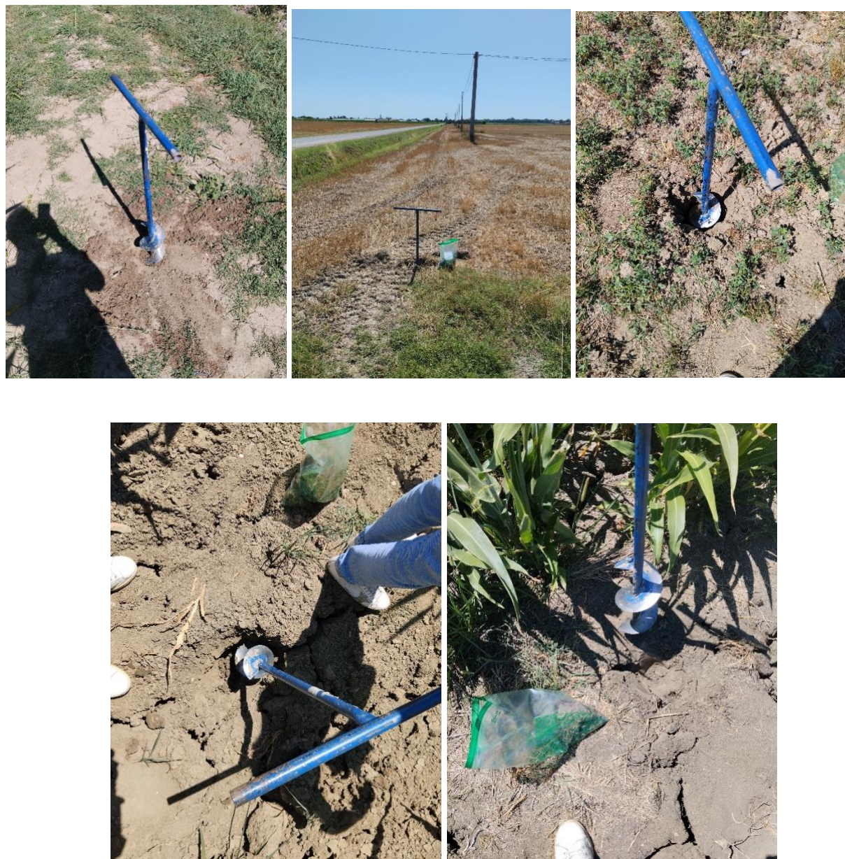
Immagine 2: Metodologia di campionamento

Il campionamento del suolo, finalizzato alle analisi chimico-fisiche del sito oggetto di studio, è stato condotto secondo le procedure indicate dal D.M. 13 settembre 1999 e dalle Linee guida ISPRA per il campionamento dei suoli. L'area è stata suddivisa in porzioni omogenee per uso e caratteristiche pedologiche, evitando zone anomale come bordure o aree di passaggio. All'interno di ciascuna unità sono stati effettuati più prelievi puntuali, distribuiti a zig-zag, successivamente miscelati per ottenere un campione composito rappresentativo dello strato di 0–30 cm, rimosso lo strato superficiale del cotico. I campioni sono stati omogeneizzati, ridotti in quantità (circa 1 kg) e confezionati in contenitori puliti ed etichettati, riportando le informazioni su localizzazione, profondità e data di prelievo. Tutte le operazioni sono state