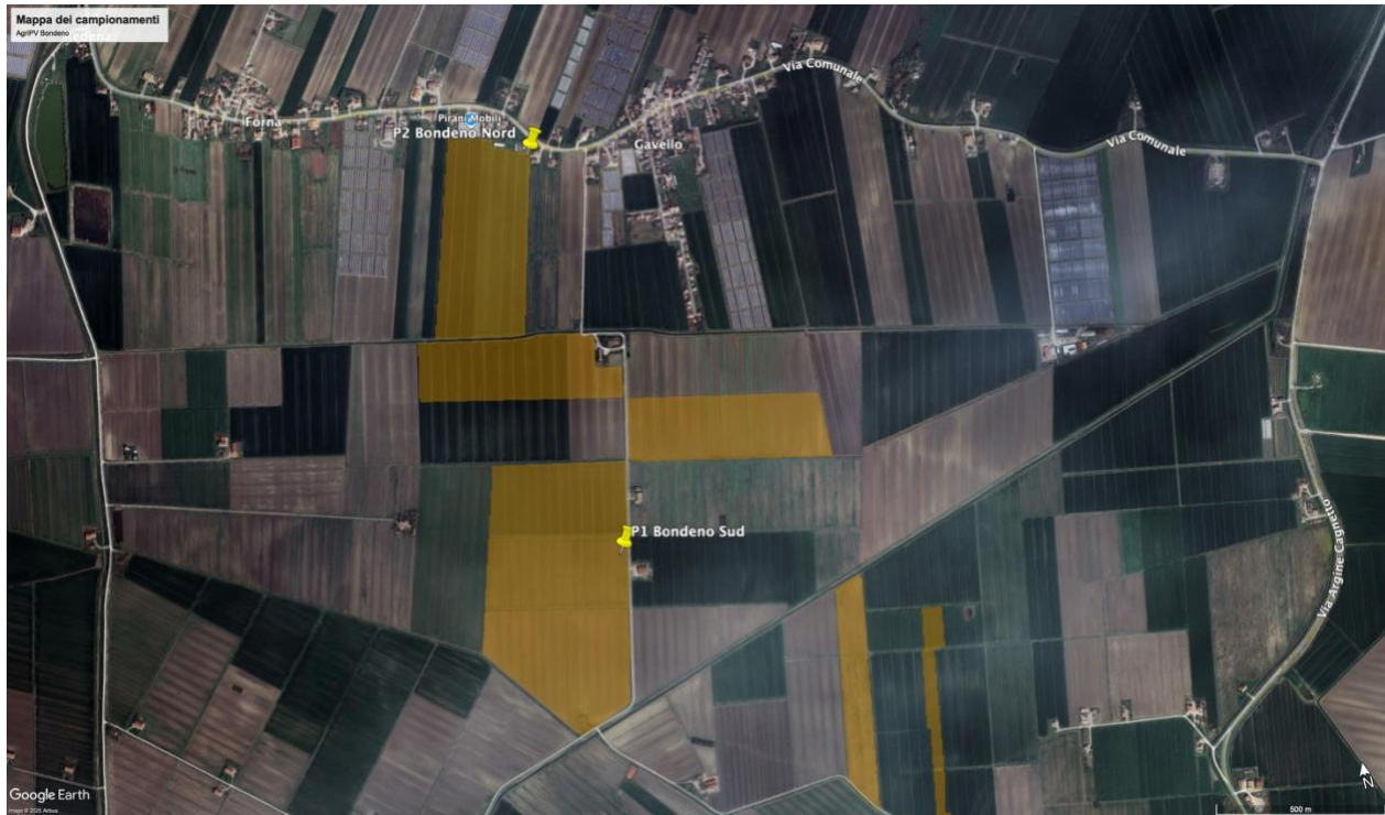
Immagine 1: Area di progetto con punti di prelievo

L'area oggetto della presente relazione è censita al N.C.T. del Comune di Bondeno (FE) e sita alle coordinate 44°54'11.50"N e 11°17'29.91"E all'altitudine di 8 m s.l.m. di media. I punti di prelievo dei due campioni vengono riportati in figura 1.