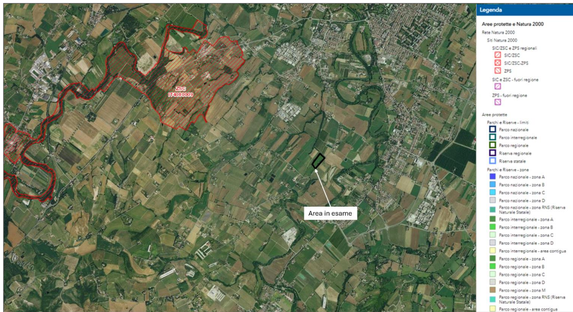
Figura 1 – Localizzazione dell’area di intervento rispetto alle aree protette ed ai siti di Rete Natura 2000