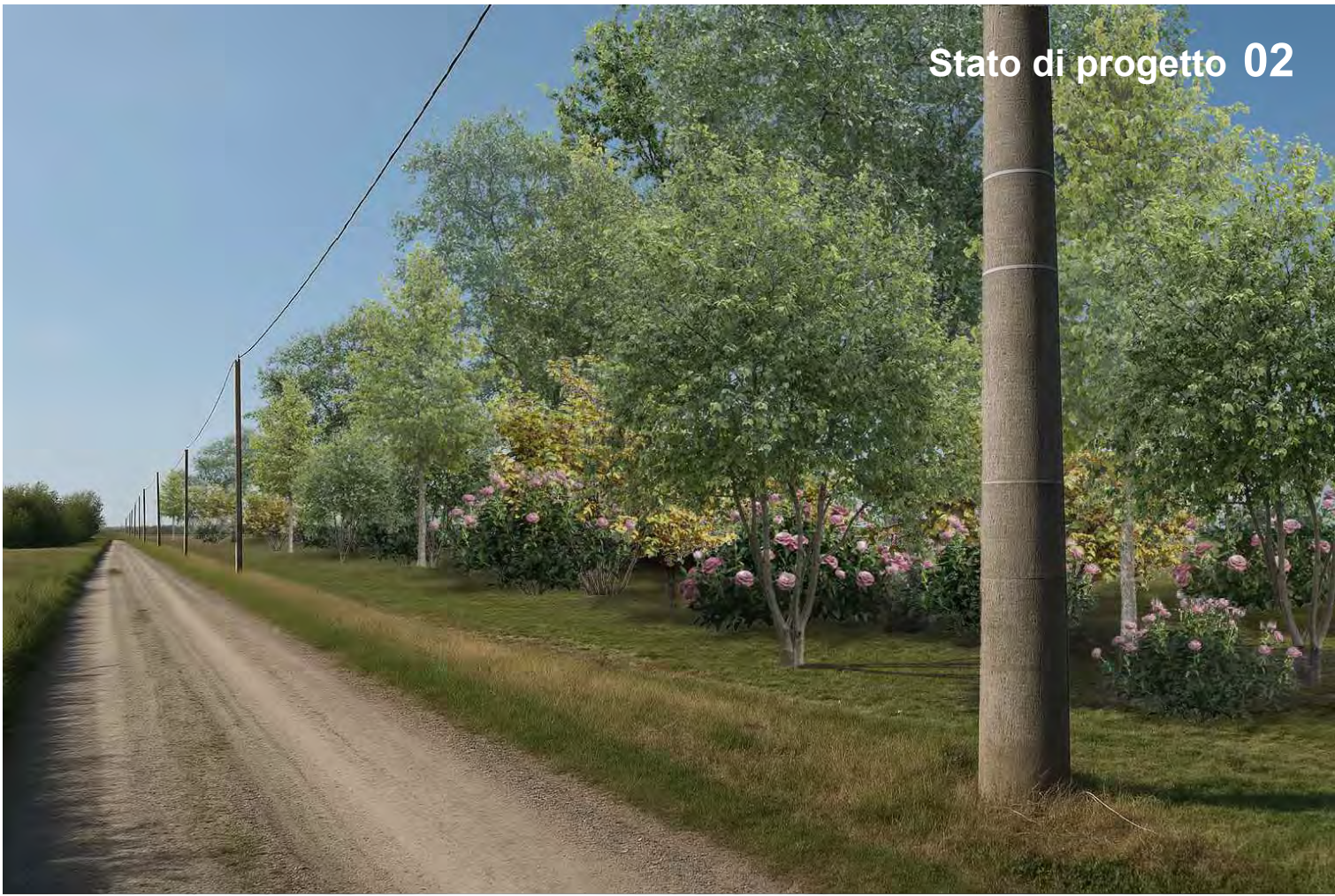
Stato di progetto 02