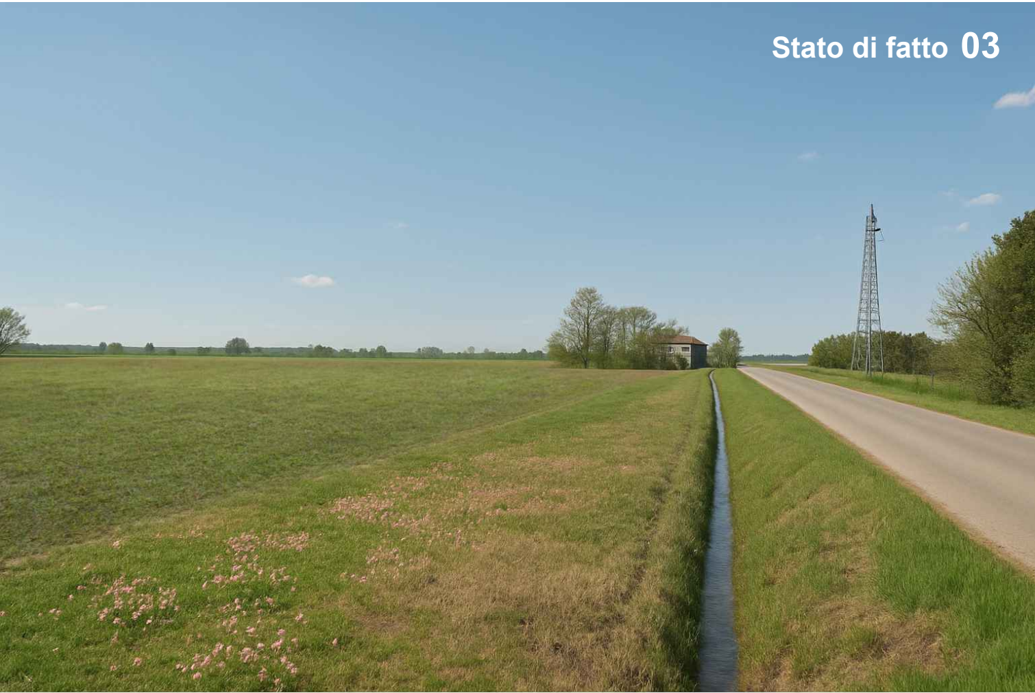
Stato di fatto 03