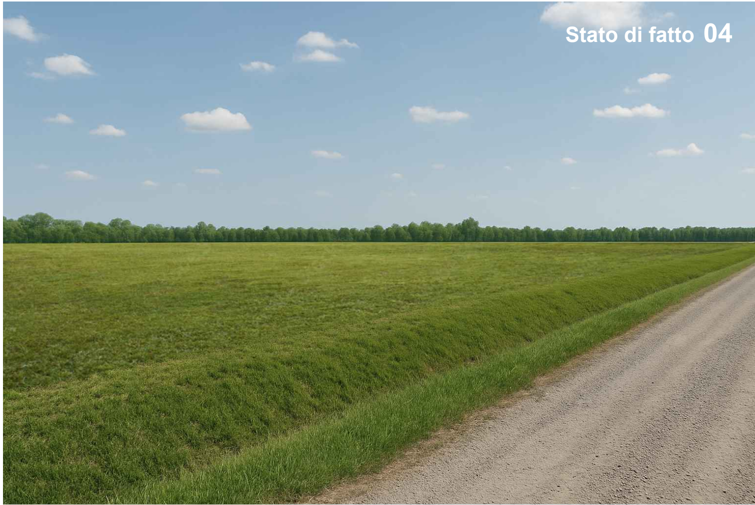
Stato di fatto 04