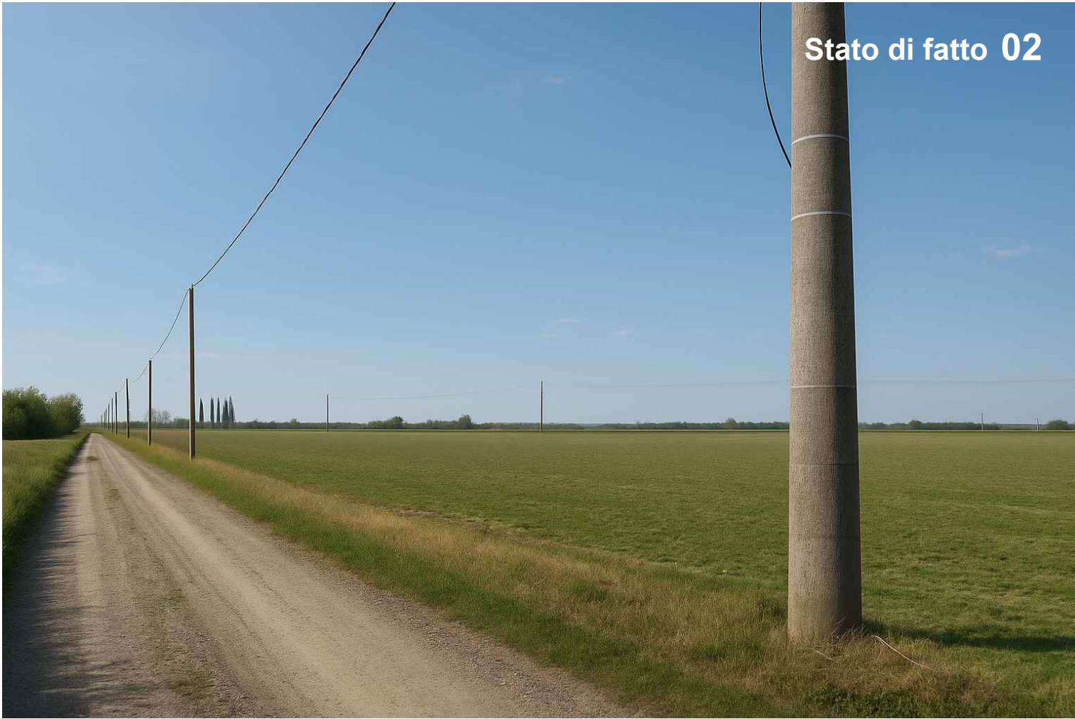
Stato di fatto 02