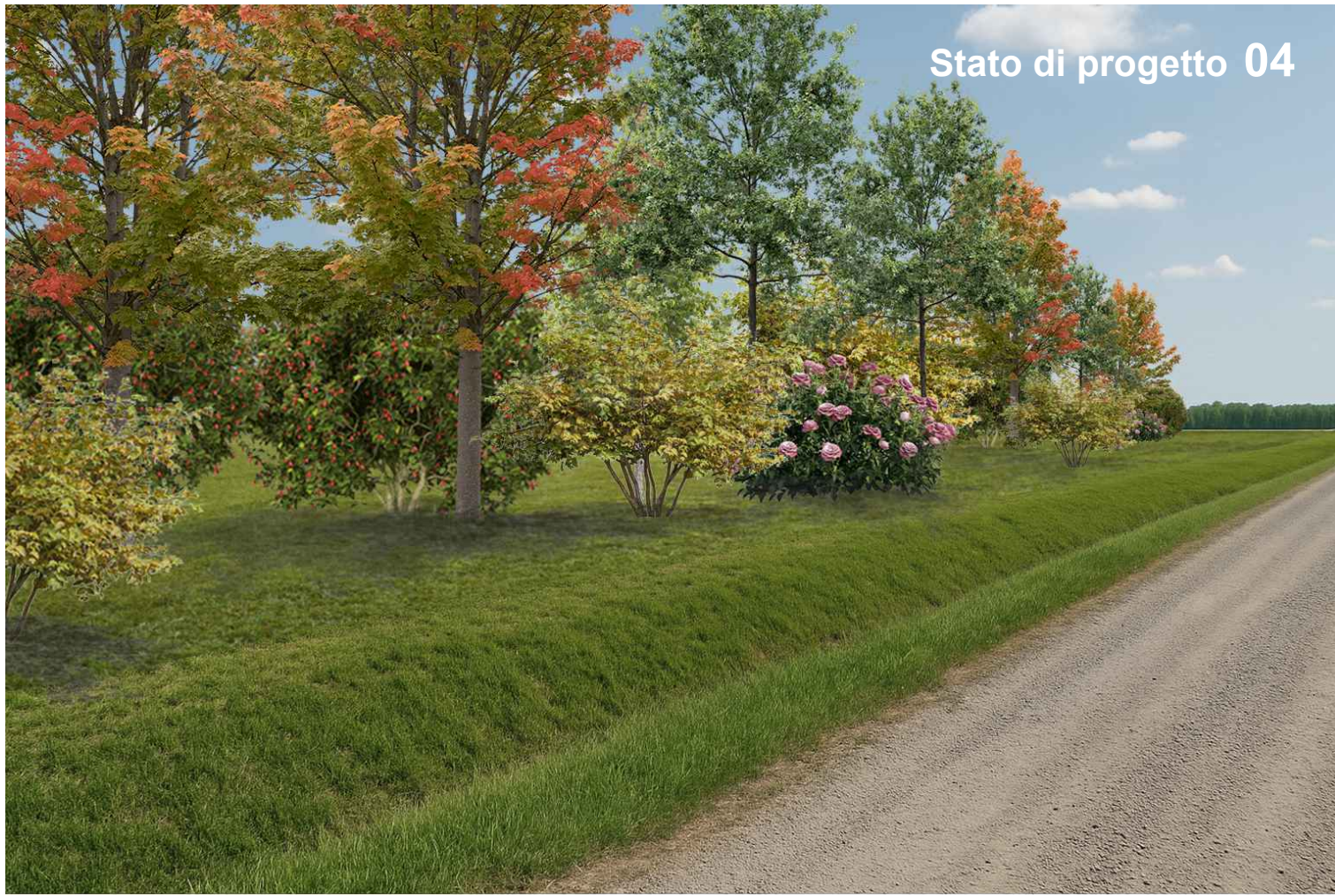
Stato di progetto 04