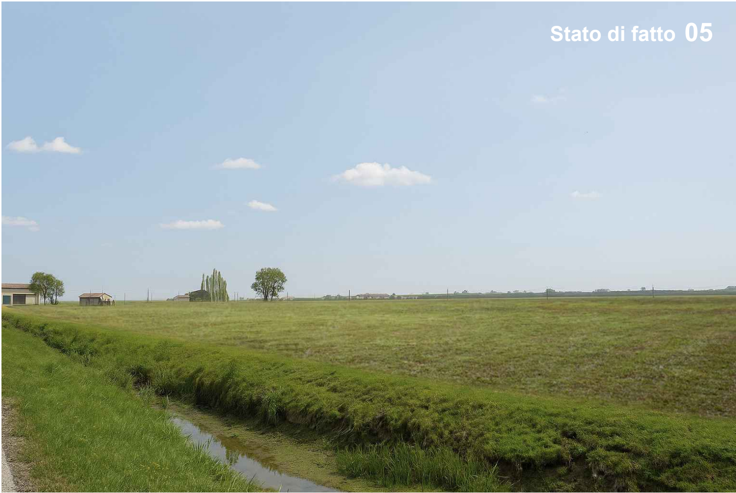
Stato di fatto 05