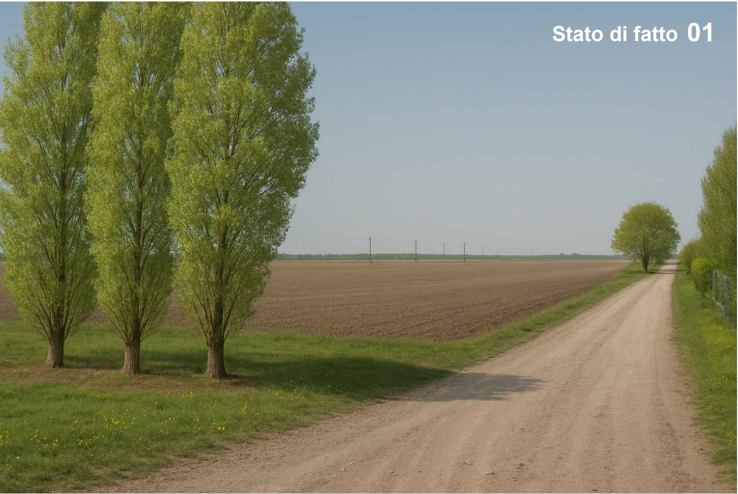
Stato di fatto 01