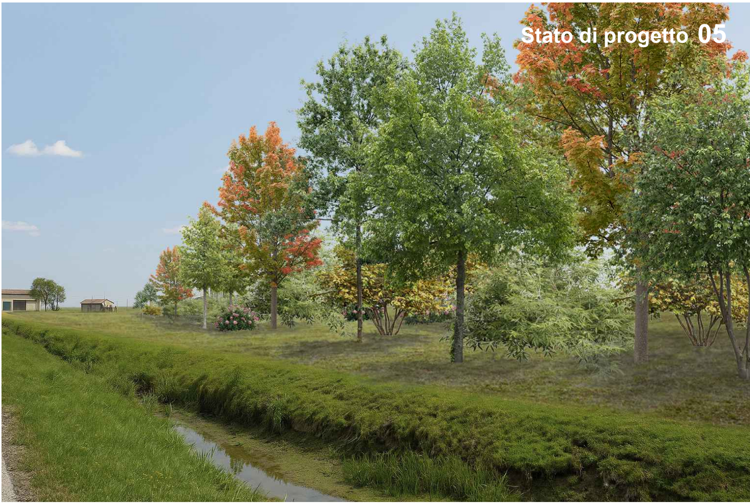
Stato di progetto 05