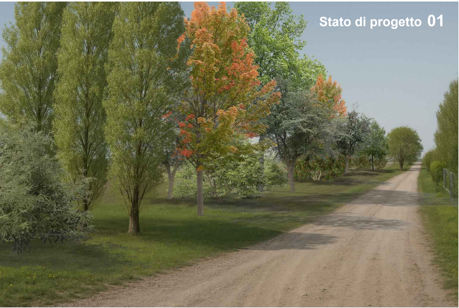
Stato di progetto 01