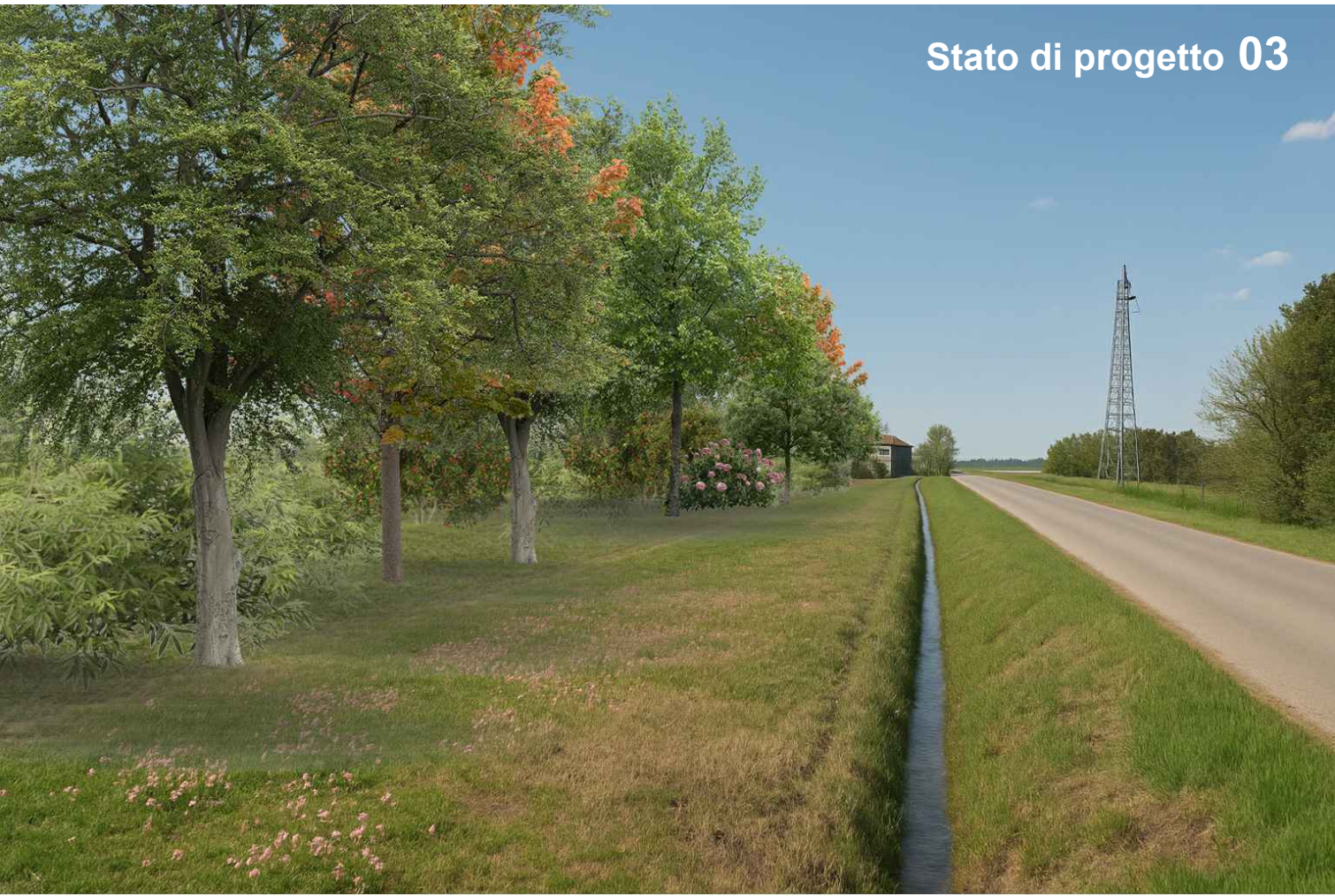
Stato di progetto 03