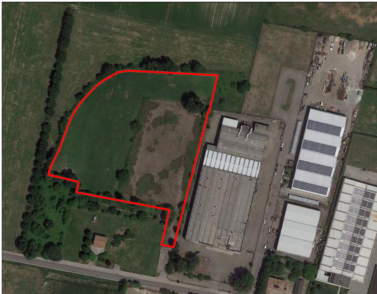
Figura 1 – Area di intervento

L'area di intervento è ubicata nel Comune di Mirandola (MO) in via di Mezzo, snc come riportato nella figura che segue.