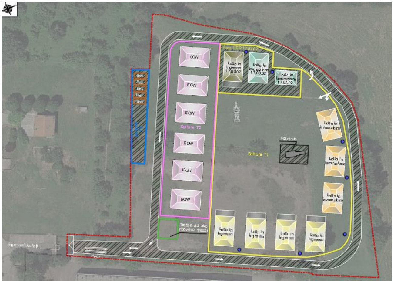
Figura 2 – Stralcio tavola 25-C021_GEN.01.04.R1 – Layout impianto di recupero rifiuti