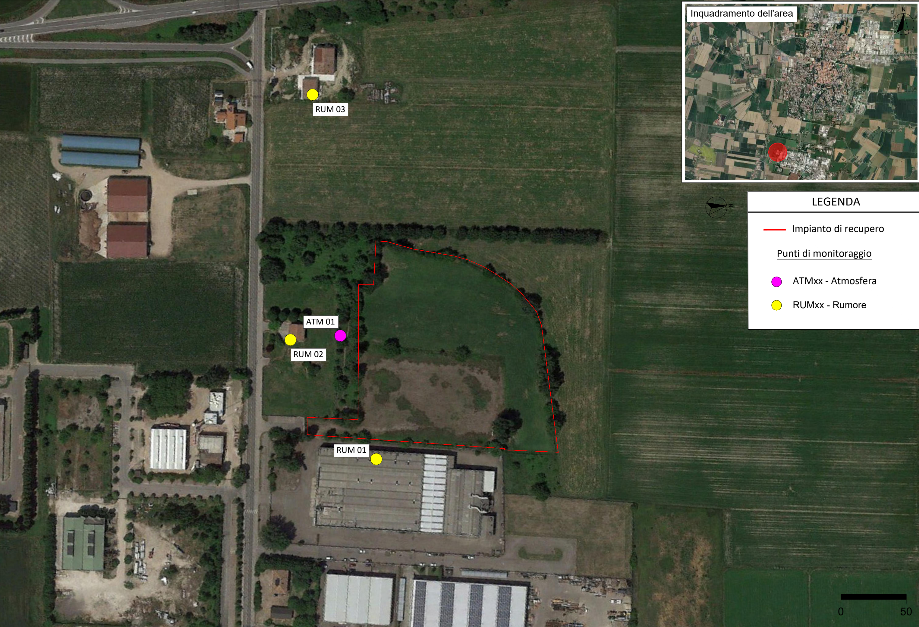
Allegato 1- Ubicazione dei punti di monitoraggio ambientale