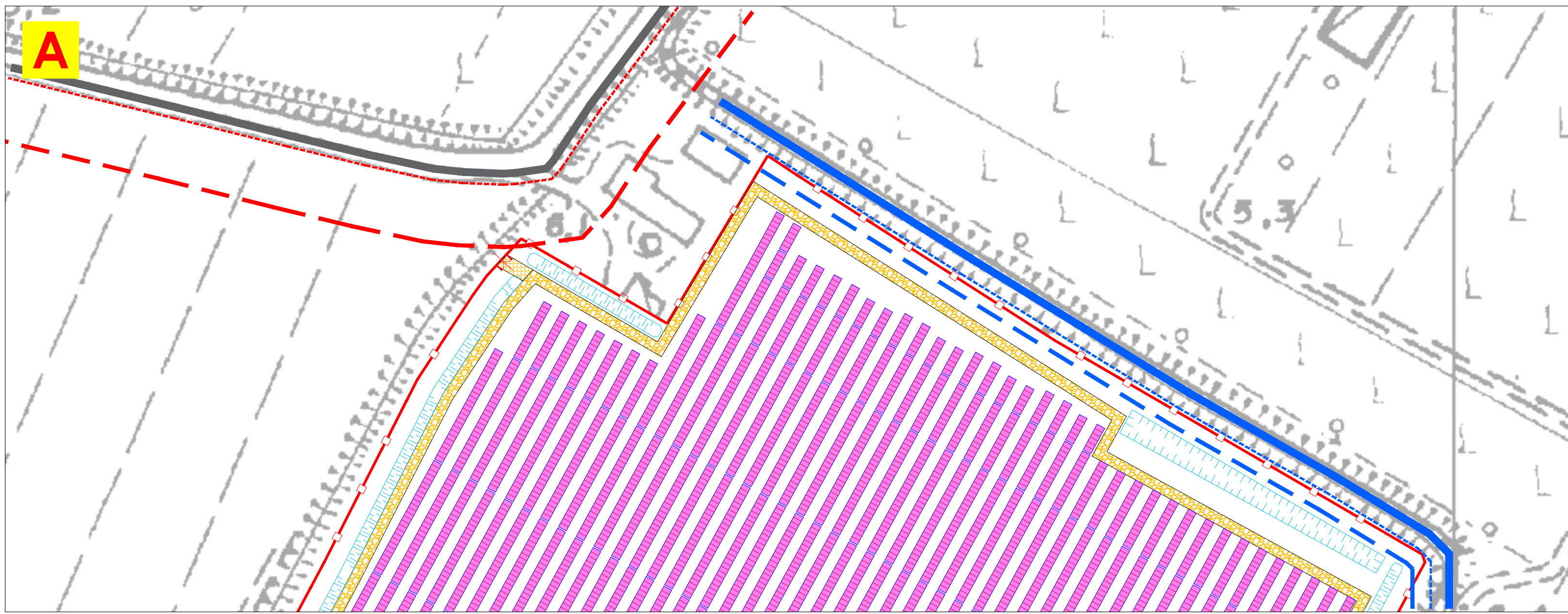
AREA CAMPIONE "A" scala 1:1000