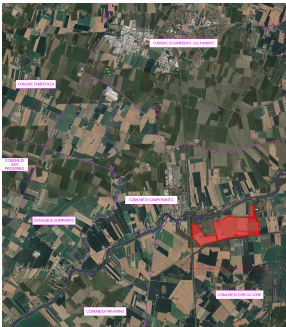
Figura 3. : Ortofoto con localizzazione delle opere in progetto (in rosso l'area di impianto).

A seguire si riporta l'inquadramento del progetto su base ortofoto: