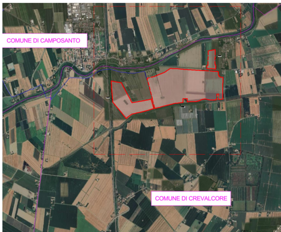
Figura 1: Ortofoto con localizzazione delle opere in progetto (in rosso l'area di impianto) con confini comunale (in viola).