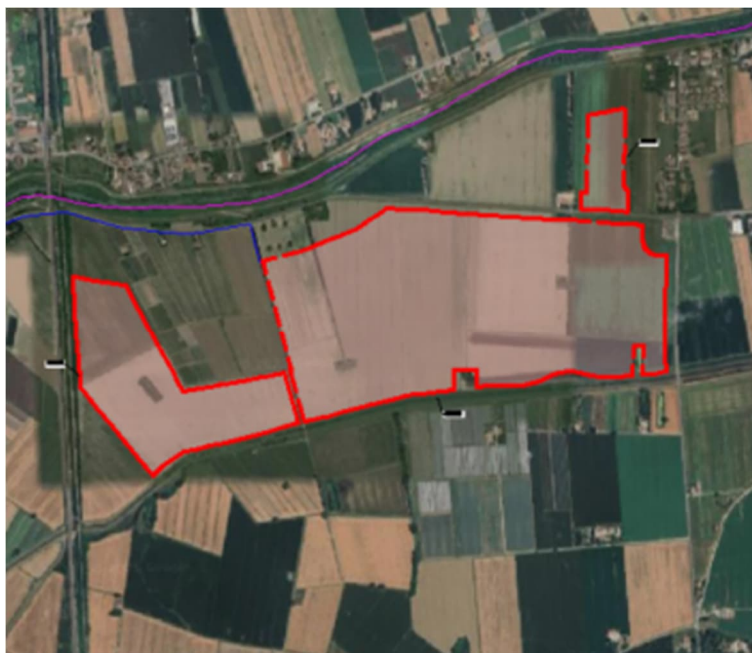
Figura 4: Inquadramento delle opere di progetto su ortofoto, nel quale si evidenzia, l'area di progetto (in rosso), il cavidotto di connessione (in ciano), l'area Stallo RTN (in verde), della stazione SE di Terna (in blu).

seguito si riporta l'inquadramento dell'intera area di studio su mappa catastale: