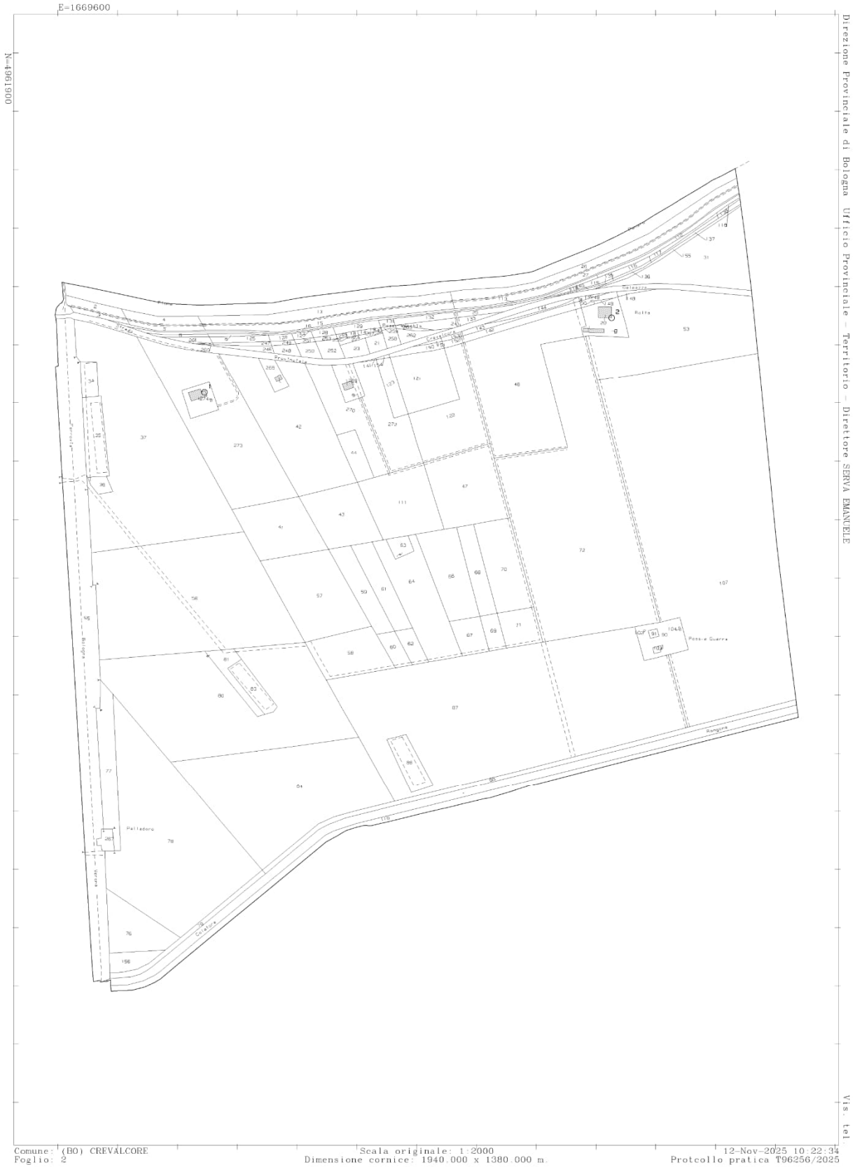
Figure 2: Mappa catastale fg 3 Crevalcore