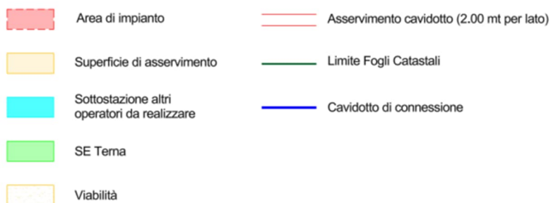
Figura 5: Inquadramento catastale delle opere.