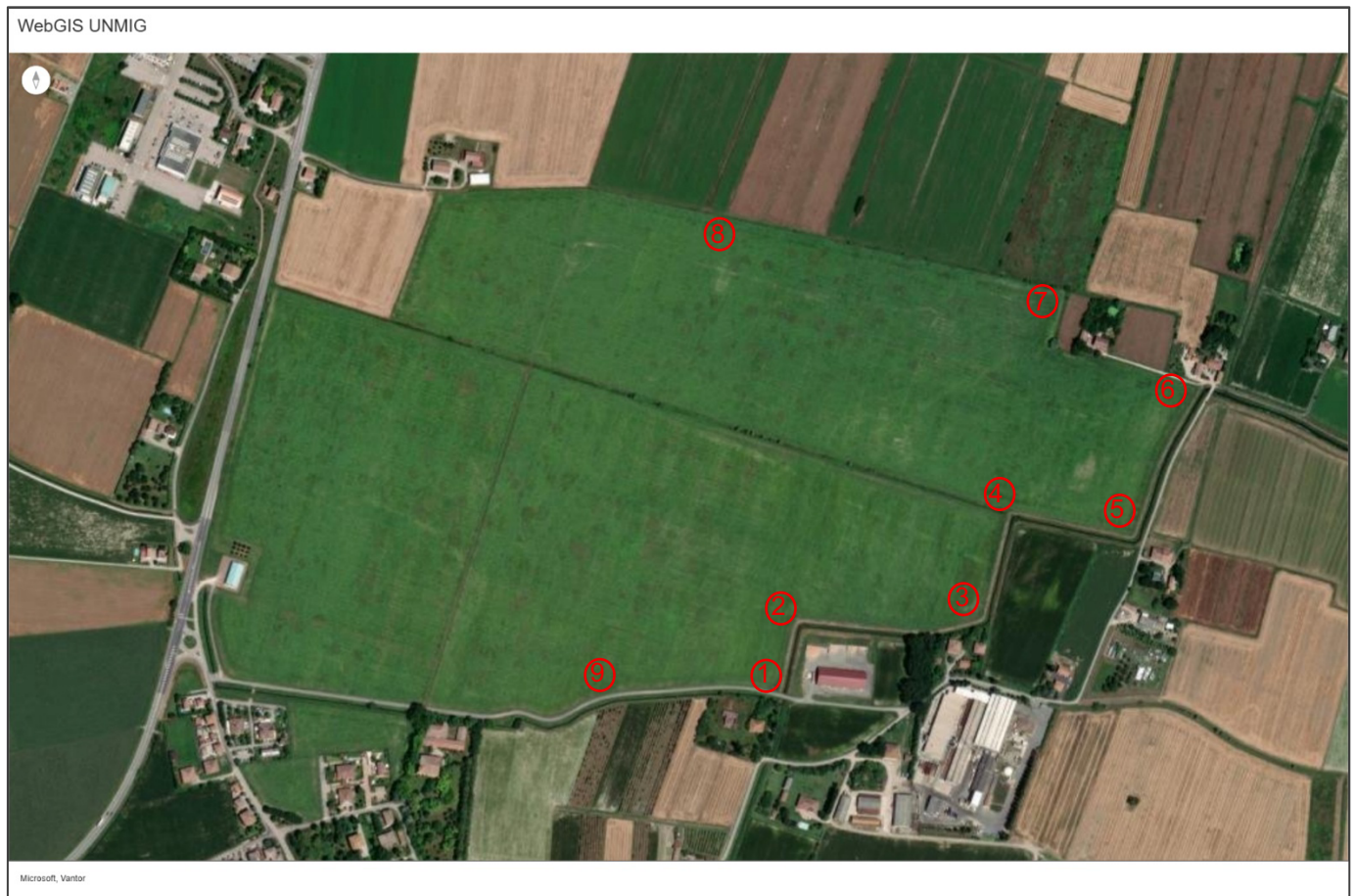
Figura 2 – Punti di verifica