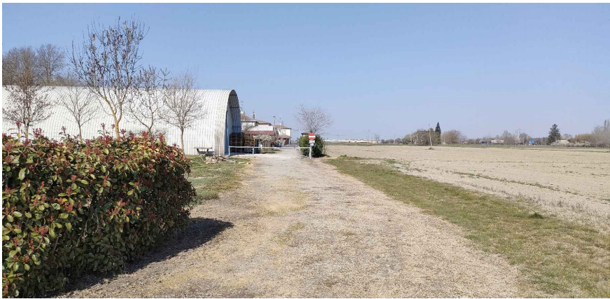
Fotoinserimento 4 Vista accesso ovest e interfaccia fabbricati esistenti, confronto tra stato di fatto e stato di progetto