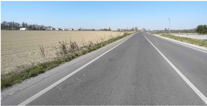
Fotoinserimento 5 Vista SP255, confronto tra stato di fatto e stato di progetto