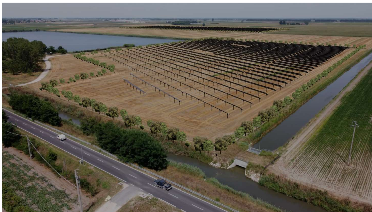
Figura 12 - Punto di osservazione 2 post-intervento