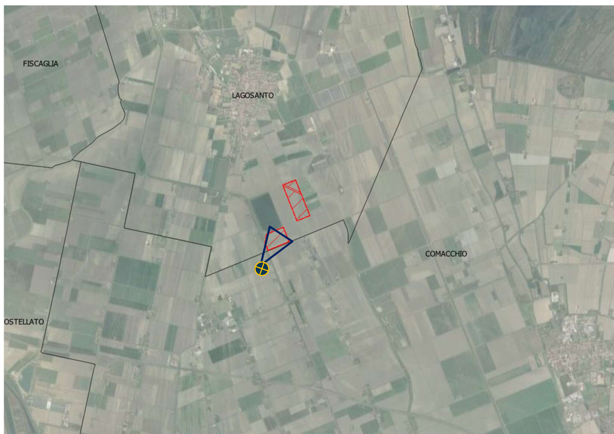
Figura 10 - Cono visibilità punto di osservazione 2