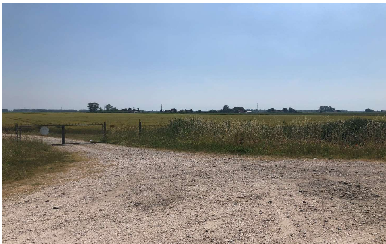
Figura 17 - Punto di osservazione 4 pre-intervento