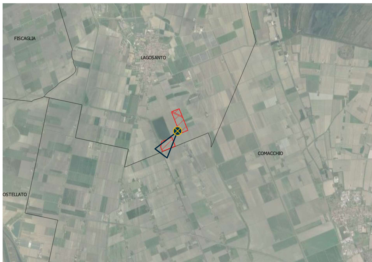
Figura 13 - Punto di osservazione 3