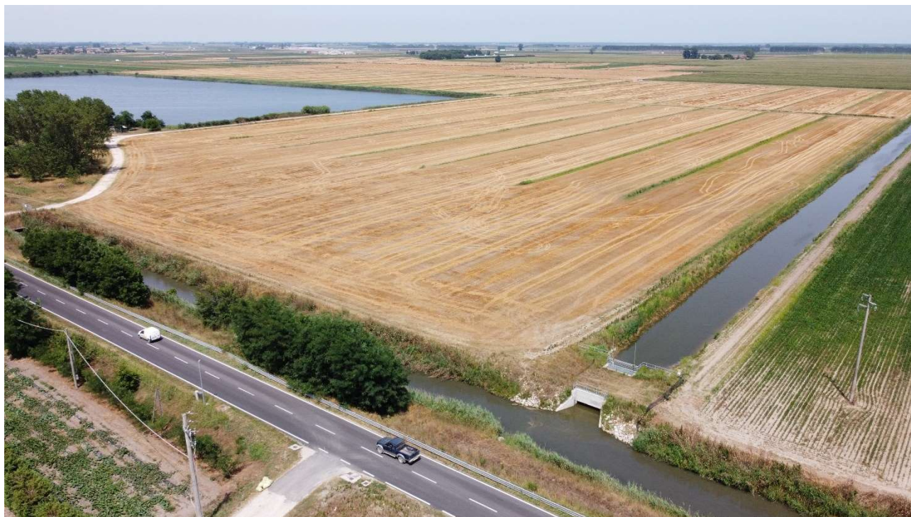
Figura 11 - Punto di osservazione 2 pre-intervento