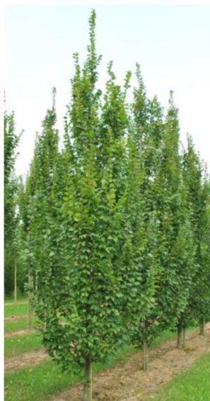
Figura 6 - Carpino bianco

Al fine di garantire lo sviluppo ottimale e l'attecchimento degli elementi vegetali, sarà prevista la realizzazione di un impianto d'irrigazione compressivo di ale gocciolanti in materiale plastico, in modo da poter garantire un'ottimale distribuzione dell'acqua a ciascun esemplare. Ad attecchimento ultimato, si provvederà alla sola irrigazione di soccorso.