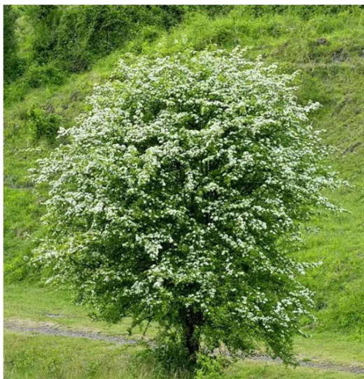
Figura 5 – Biancospino