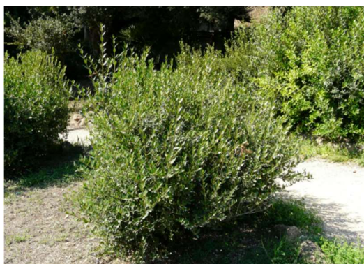
Figura 3 - Fillirea