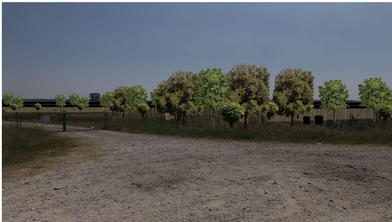
Figura 18 - Punto di osservazione 4 post-intervento