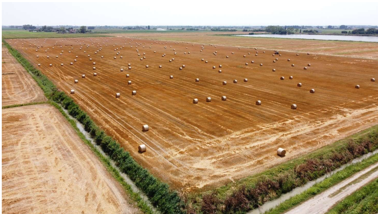
Figura 8 - Punto di osservazione 1 pre-intervento