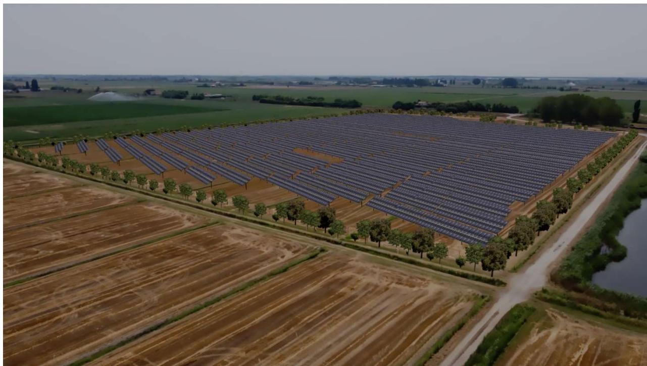
Figura 15 - Punto di osservazione 3 post-intervento