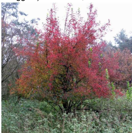
Figura 2 - Fusaggine