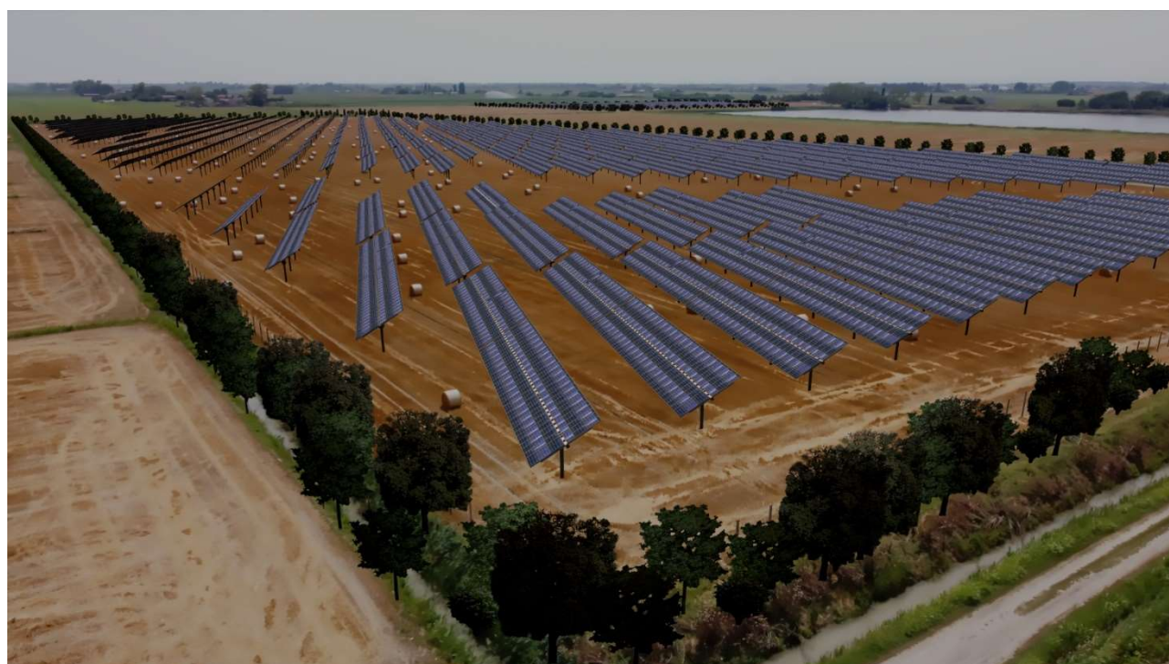
Figura 9 -Punto di osservazione 1 post-intervento