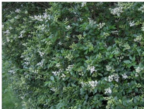
Figura 1 - Ligustro comune