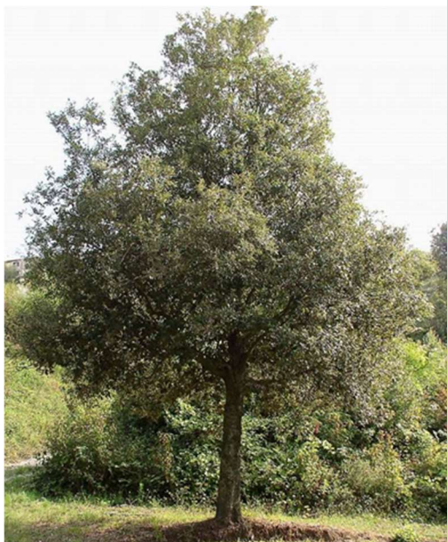
Figura 4 – Leccio