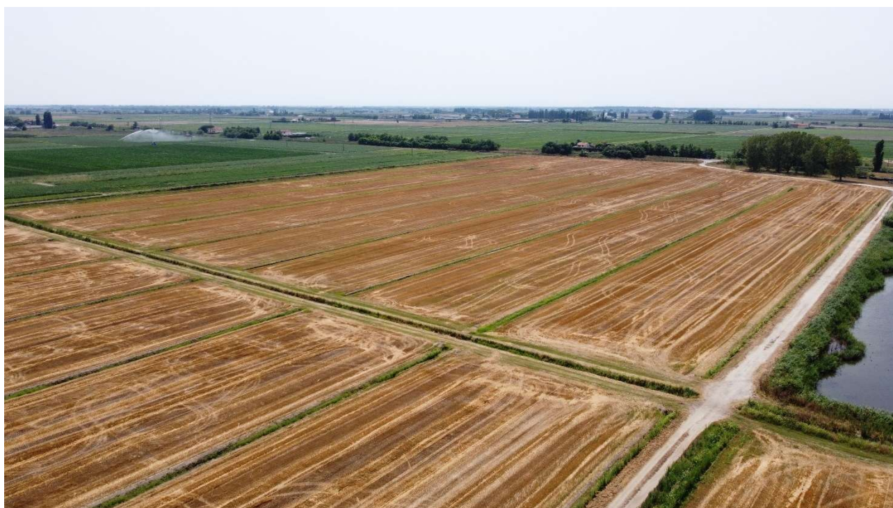
Figura 14 - Punto di osservazione 3 pre-intervento