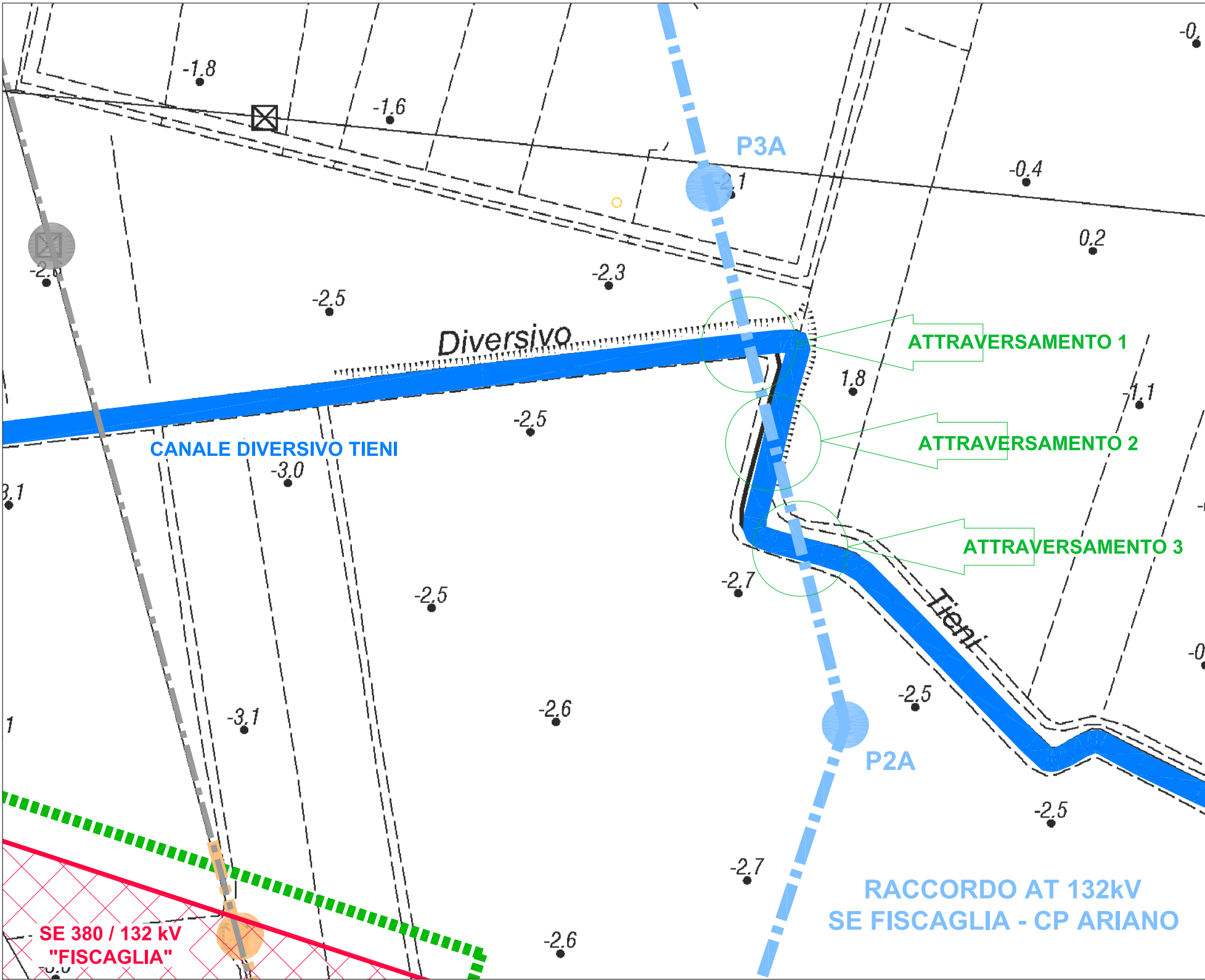
PLANIMETRIA CATASTALE 1:2.000