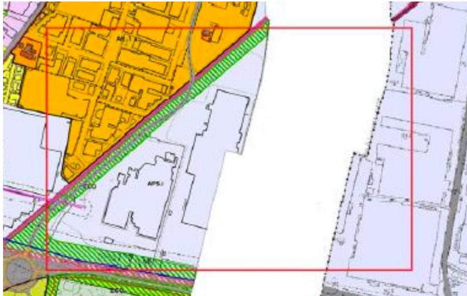
Estratti PSC di Sassuolo (art. 54 – 57) e PSC di Fiorano (art. 43,56,58) con individuazione dell'area interessata

Il RUE disciplina le modalità d'intervento nelle porzioni urbanizzate di tale sub-ambito nel rispetto dei criteri evidenziati all'art. 24 del RUE di Sassuolo e all'art 55 del RUE di Fiorano.