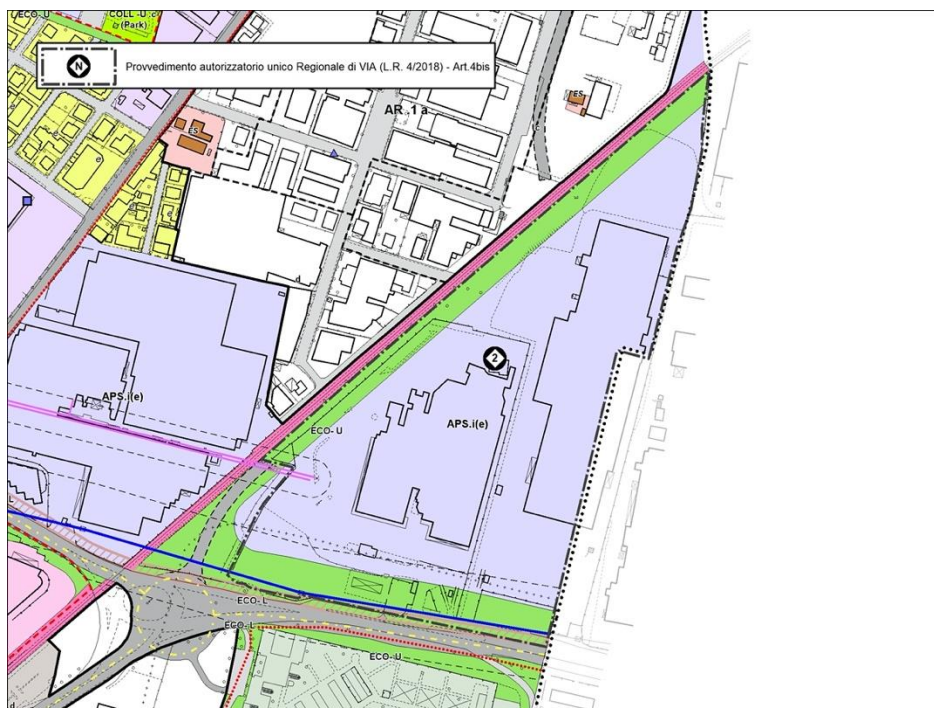
Estratto RUE del Comune di Sassuolo – Variante