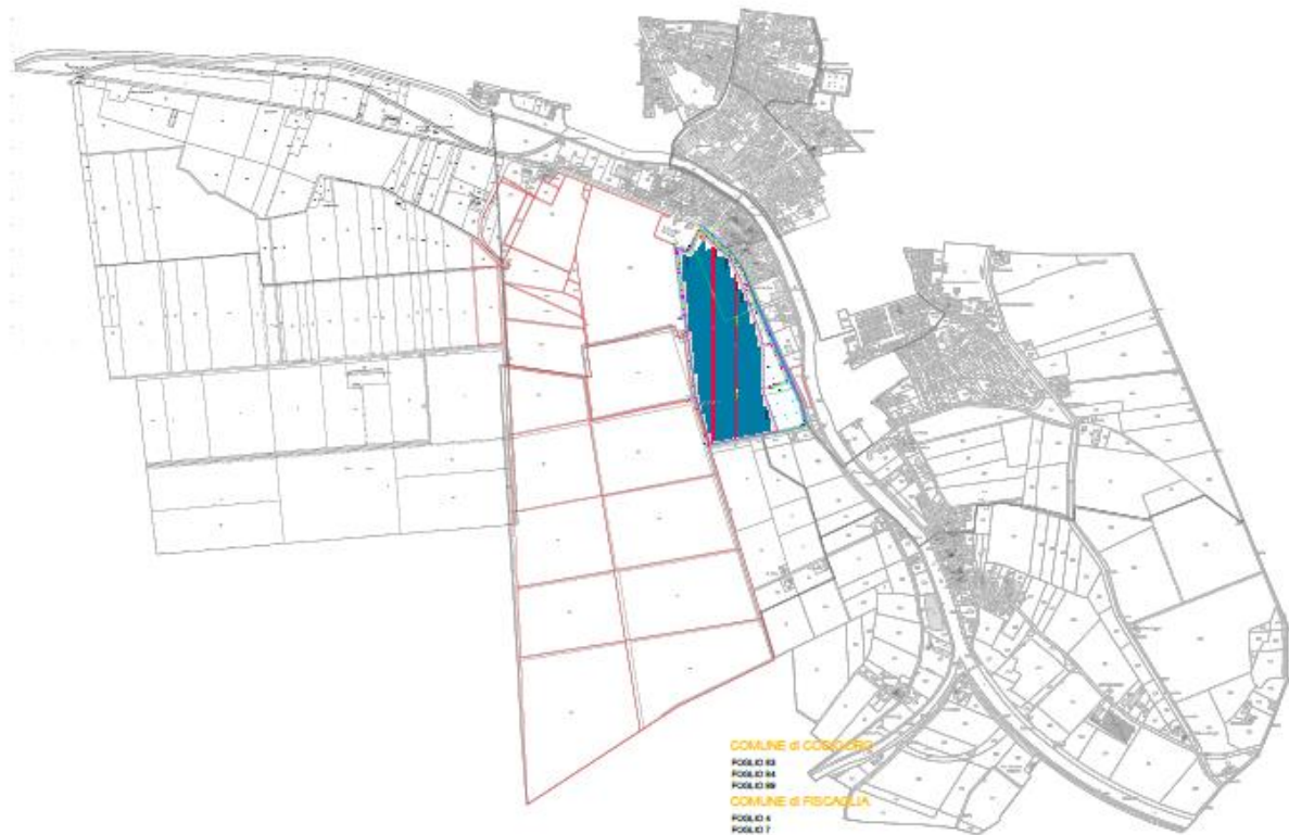
Figura 1 - Asservimento

Scopo della presente sezione è quello di illustrare le aree agricole contigue all'area destinata all'installazione dell'impianto fotovoltaico. Tali aree risultano nella disponibilità del richiedente, categorizzabili come asservimento.