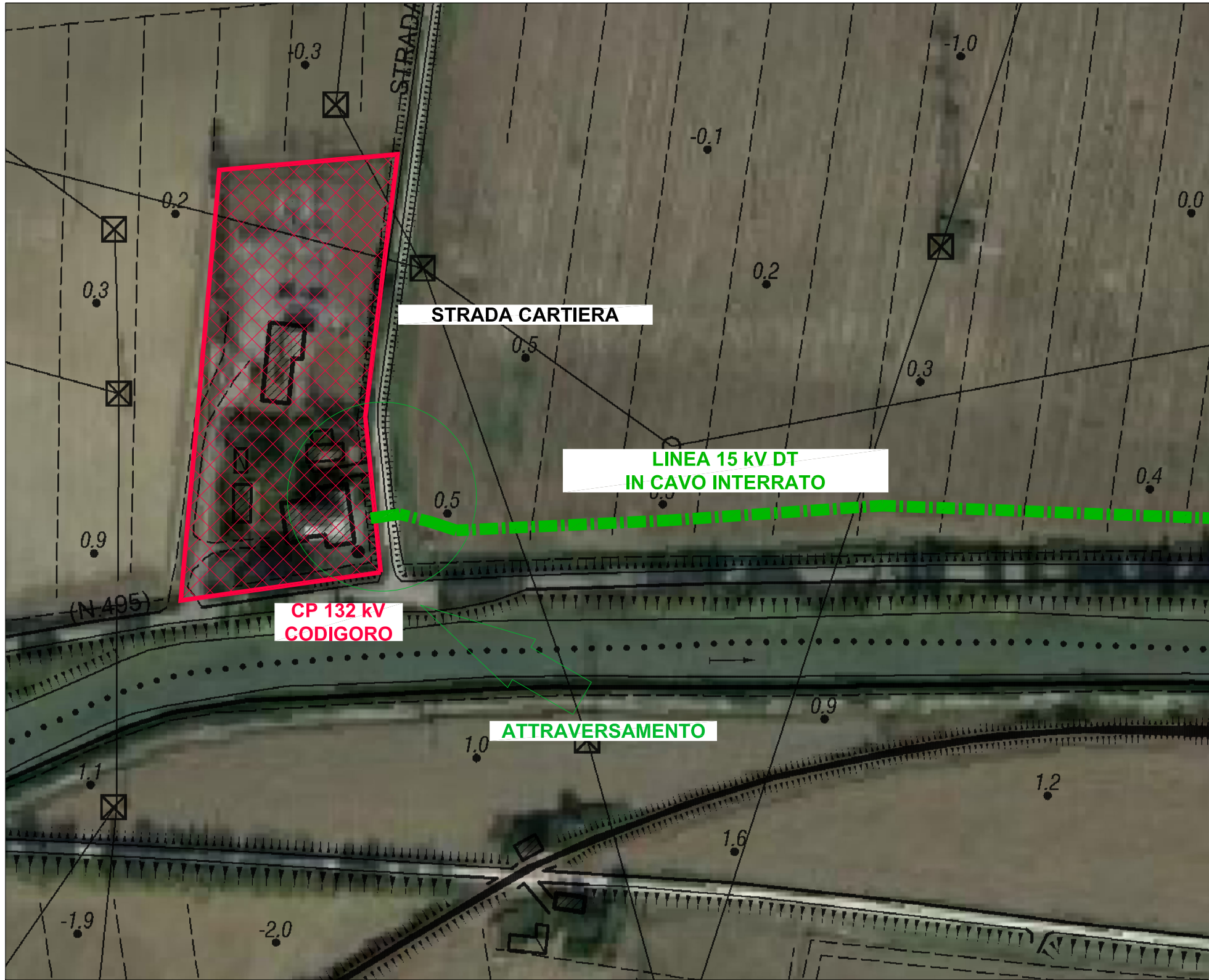
PLANIMETRIA CTR 1 : 2.000