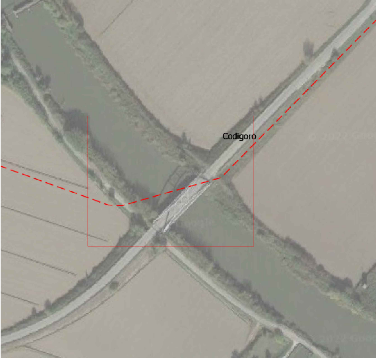
Planimetria posa cavidotto attraversamento Ponte su fiume Po Baccarini - scala 1:200