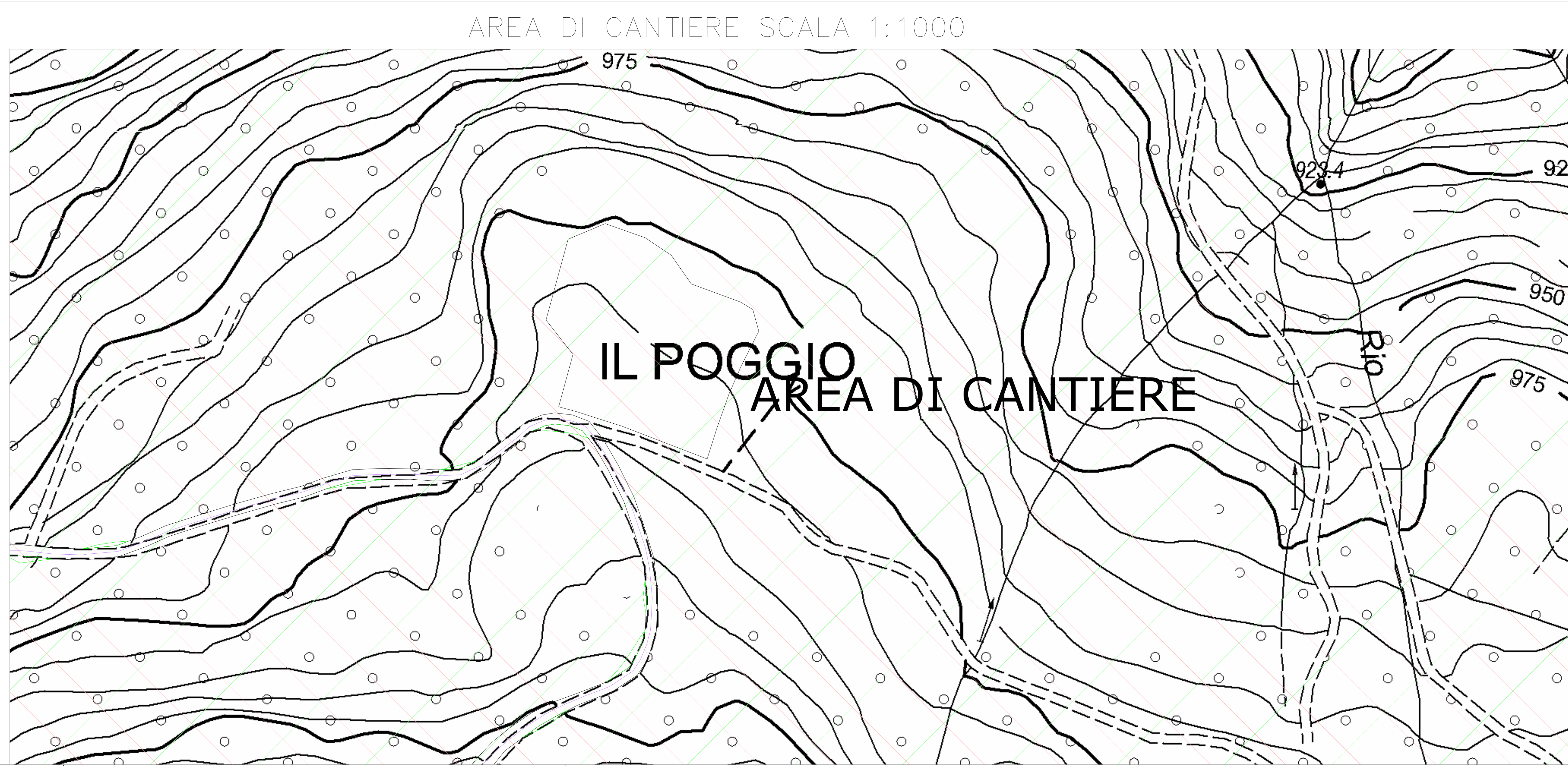
AREA DI CANTIERE SCALA 1:1000