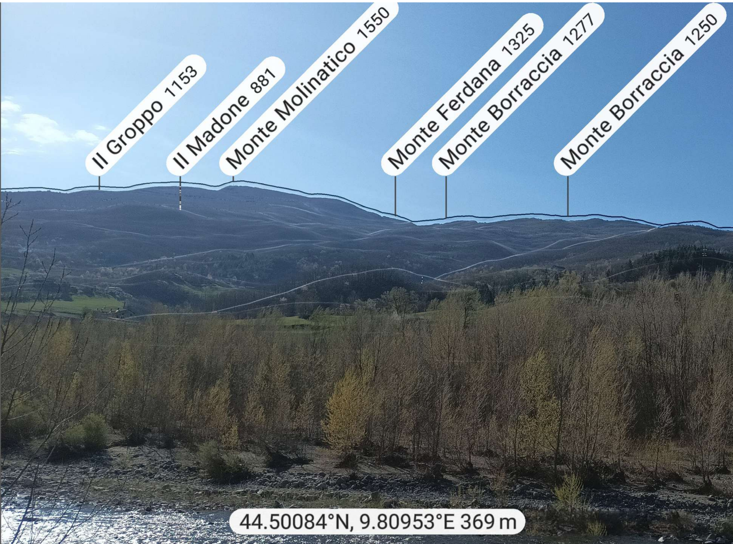
VISTA DEL CRINALE PRINCIPALE