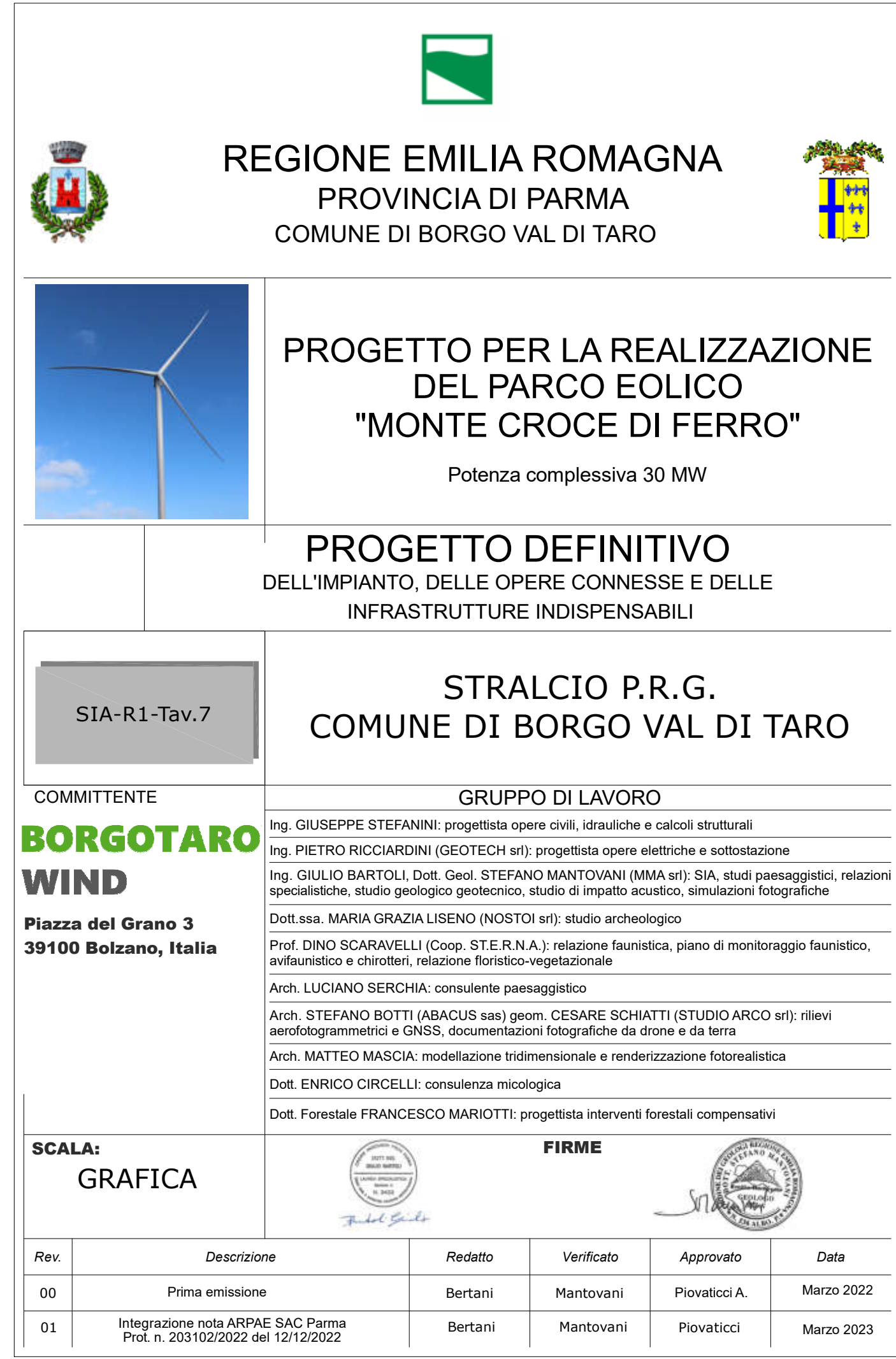
STRALCIO P.R.G. SCALA 1:2000