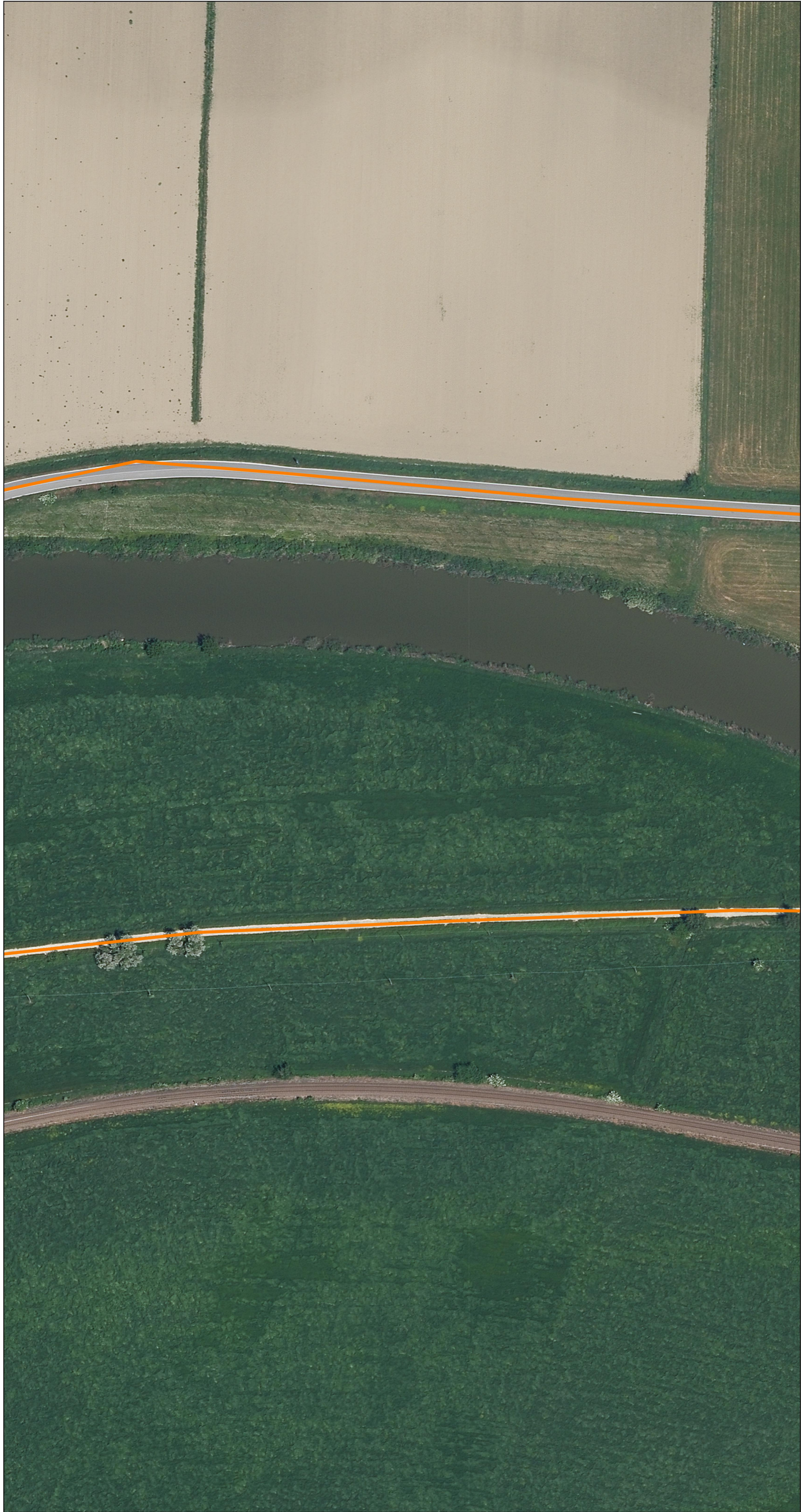
PLANIMETRIA SU ORTOFOTO scala 1:1000