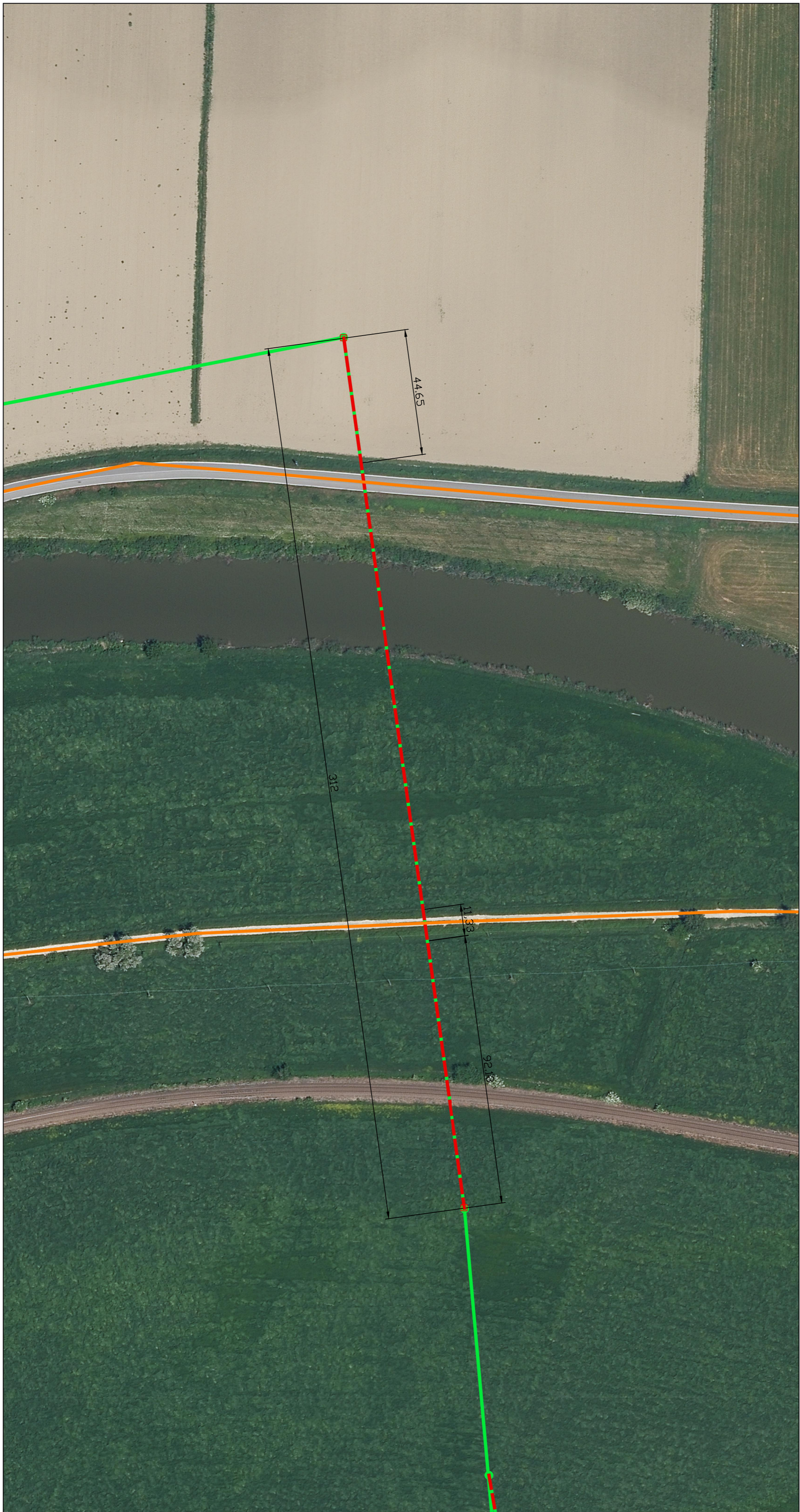
PLANIMETRIA SU ORTOFOTO scala 1:1000