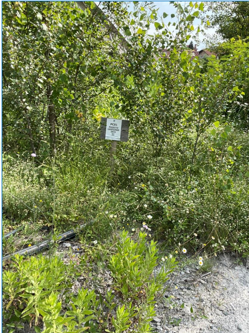
Figura 2 - Dettaglio del pozzetto d'ispezione presente a valle dello scarico