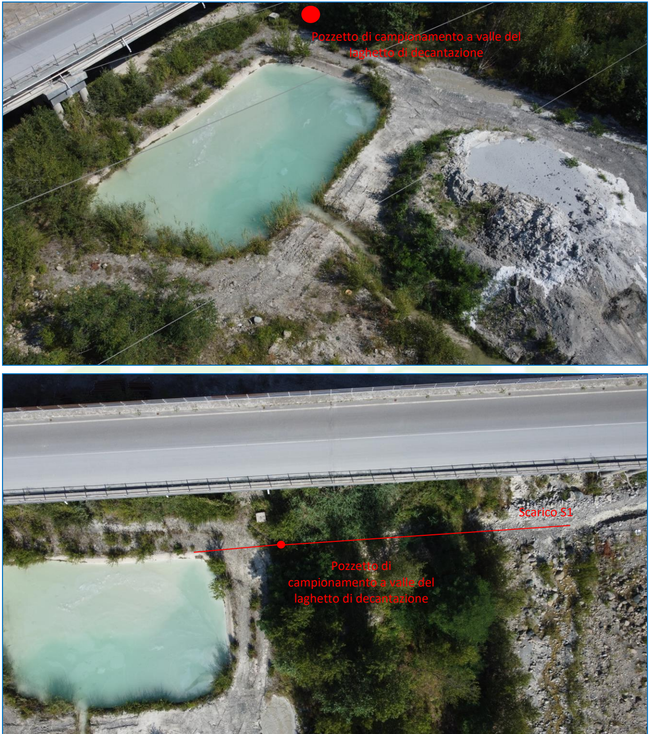
Figura 1 - Dettaglio tratto di scarico S1