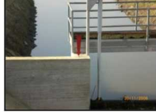
Foto 3 - Caposaldo