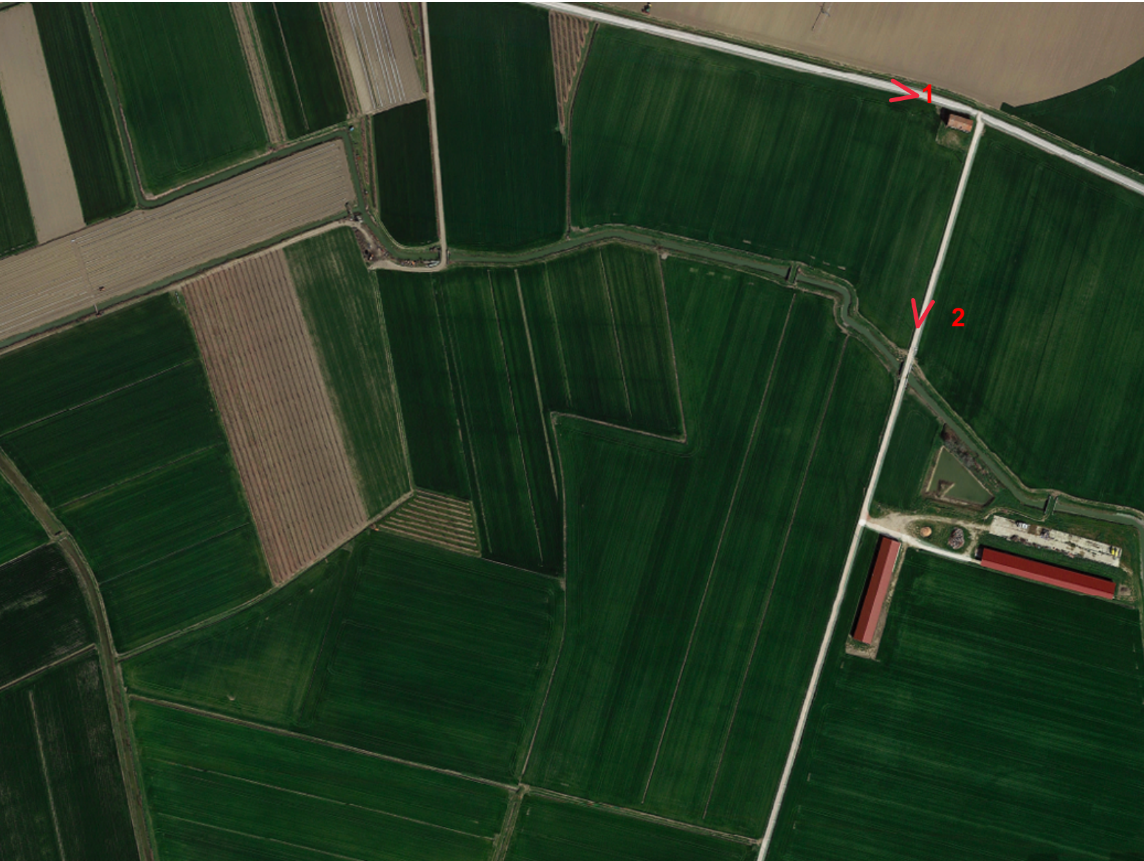
FOTOINSERIMENTO - VISTA AEREA