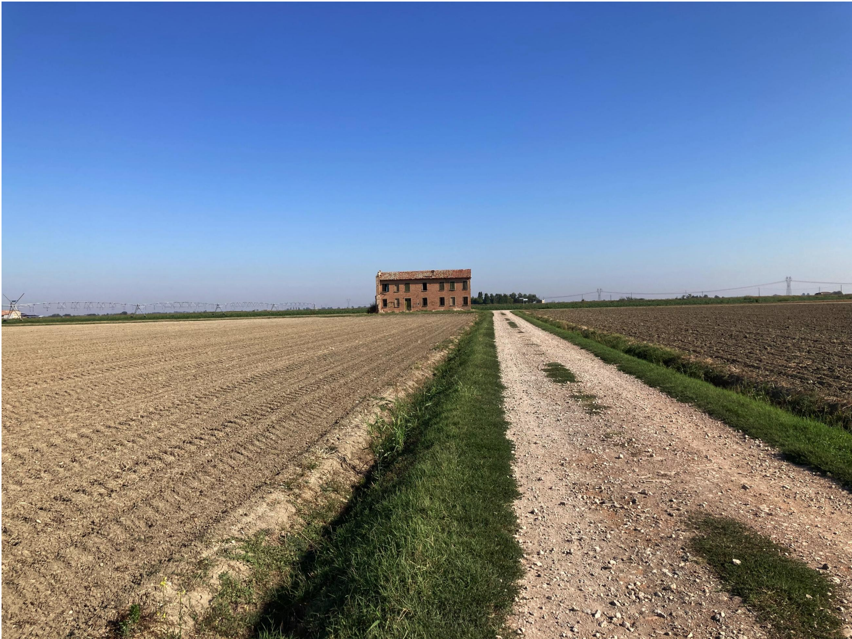
FOTOINSERIMENTO 2 - VISTA VIA CANTALUPO