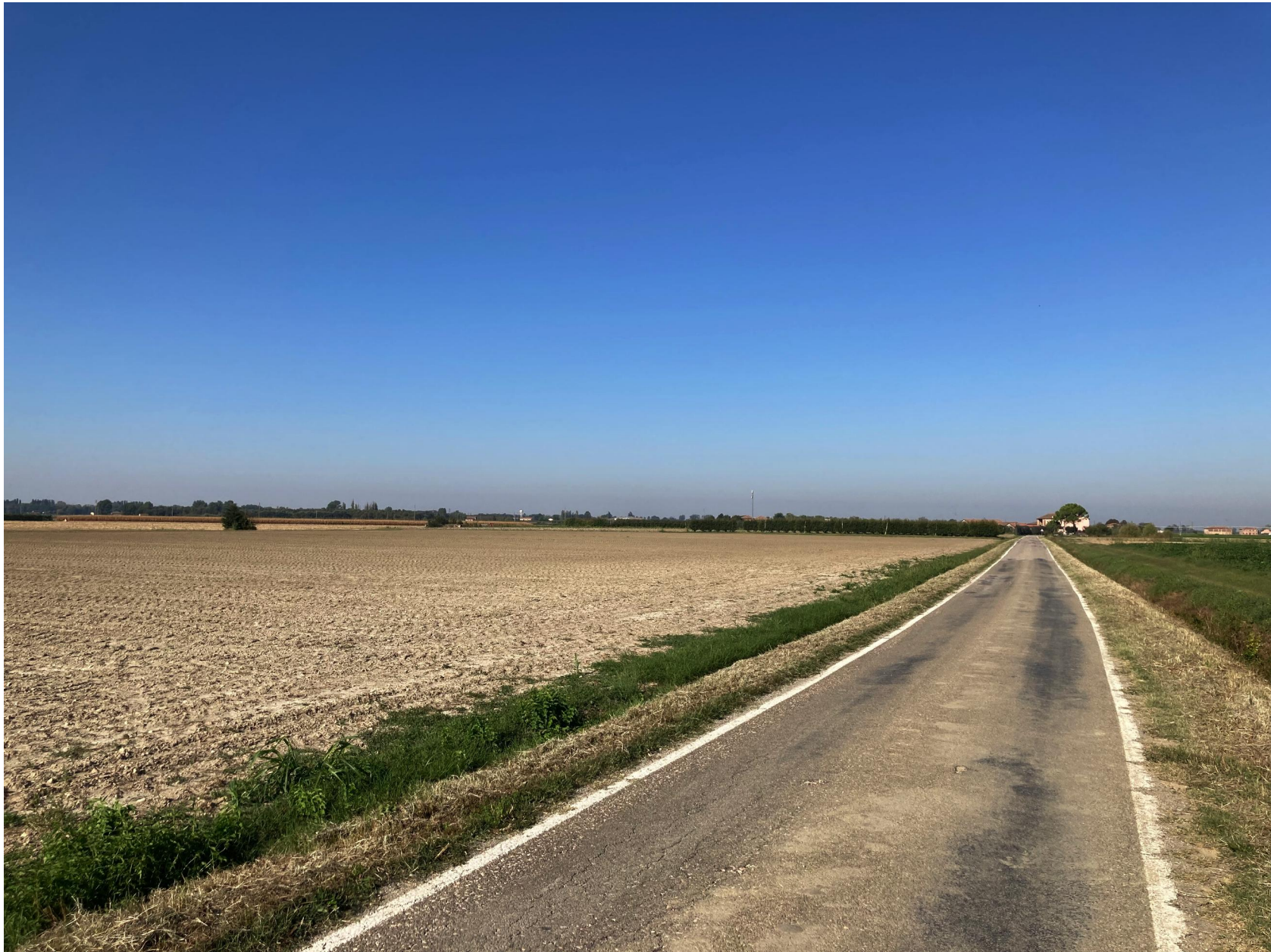
FOTOINSERIMENTO 1 - VISTA VIA ALBERONE