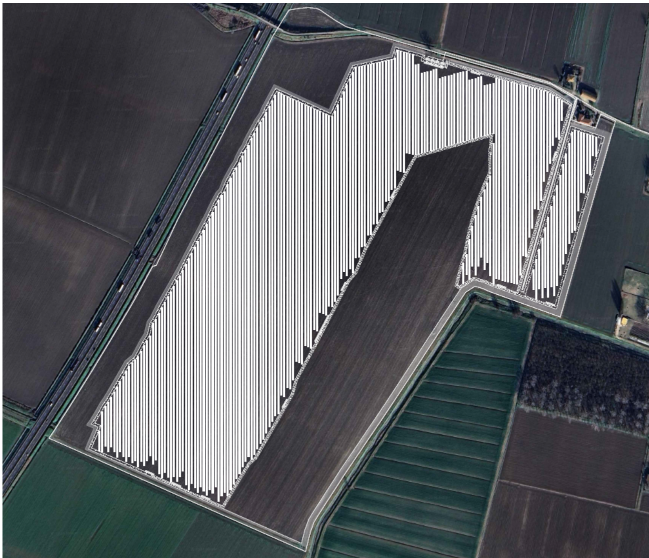
Figura 1 - Layout impianto oggetto di istanza – NEOEN RENEWABLES ITALIA Srl

I moduli fotovoltaici impiegati sono del tipo monocristallino con potenza nominale di 625 Wp, disposti su sistemi di inseguimento solare monoassiale del tipo Tracker. L'inseguitore solare sarà in grado di ruotare secondo la Diretrice EST-OVEST in funzione della posizione del Sole. La variazione dell'angolo avviene in modo automatico grazie ad un apposito algoritmo di controllo di tipo astronomico.