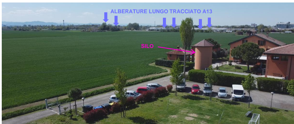
Figura 2 – Vista aerea con indicazione delle alberature lungo il tracciato della A13 e del silo

Sede Legale: Via Bigli 2, 20121 – Milano | Capitale Sociale: Euro 10.000,00 i.v. Codice Fiscale e n. iscriz. al Registro delle Imprese: 12456150965 | Numero REA: MI - 2663263 Società a socio unico | Soggetta a Direzione e Coordinamento di Chiron Energy Capital S.p.A. PEC: crv.25@pec.chironenergy.com | www.chironenergy.com