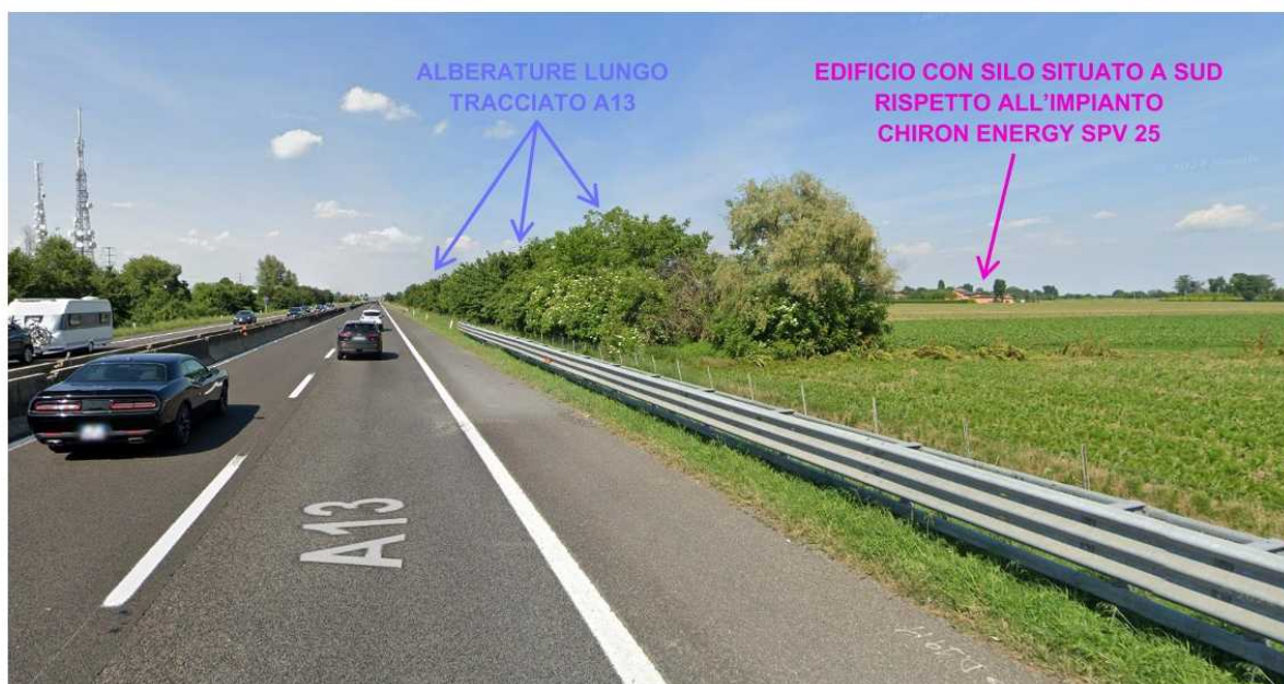
Figura 3 – Vista delle alberature lungo il tracciato della A13, dell'edificio e pertinenze situate a sud dell'impianto