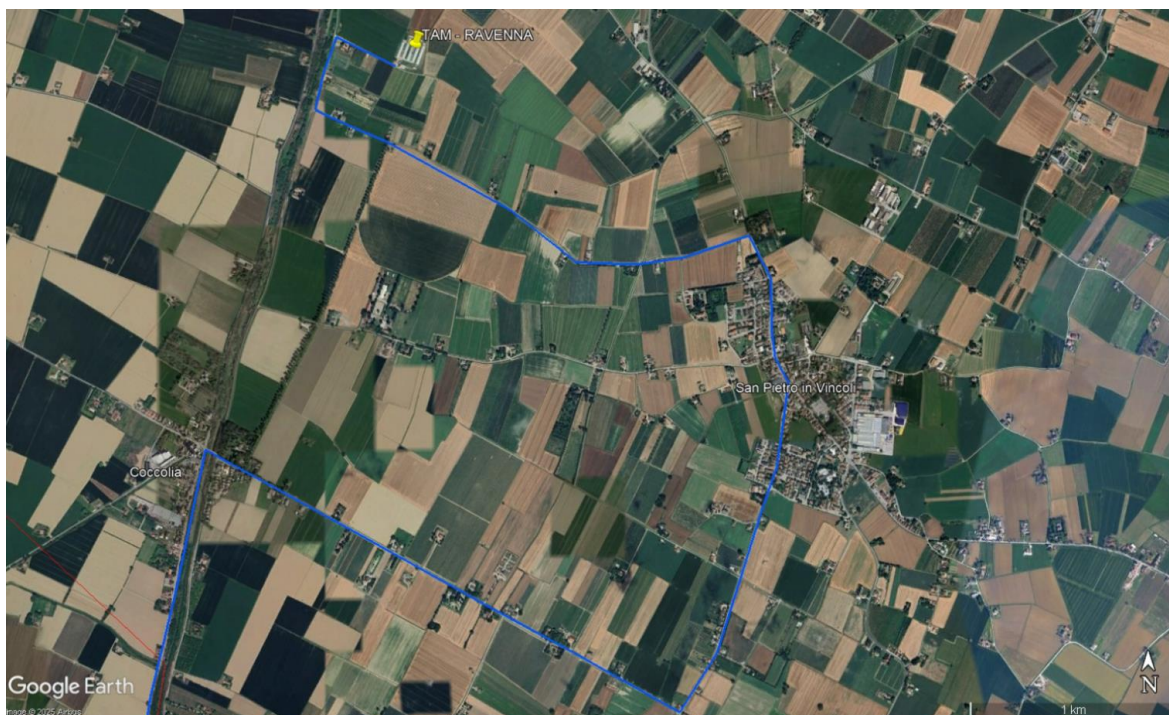
Figura 2. Individuazione del percorso dei mezzi in scala comunale – Estratto da Google Earth.

STUDIO PRELIMINARE AMBIENTALE (SPA) INTEGRAZIONI (AGGIORNAMENTO)