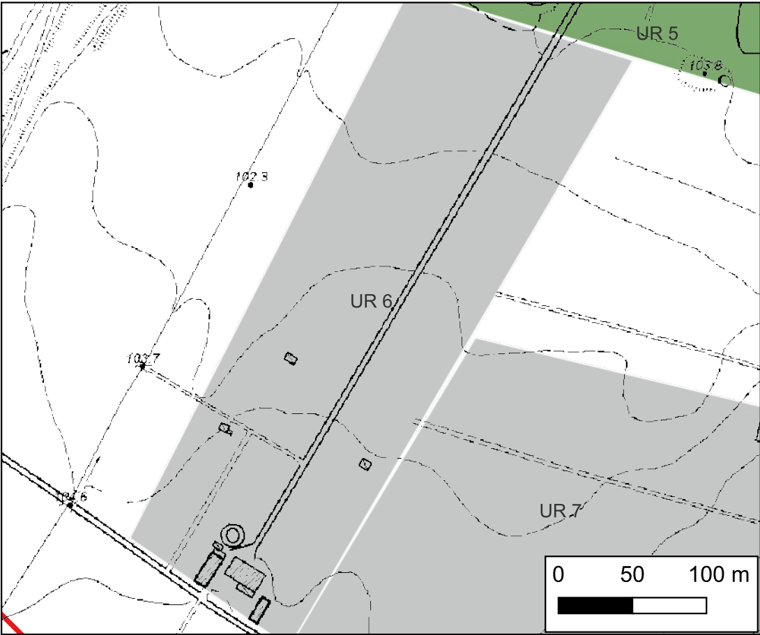
Area in proprietà privata non accessibile