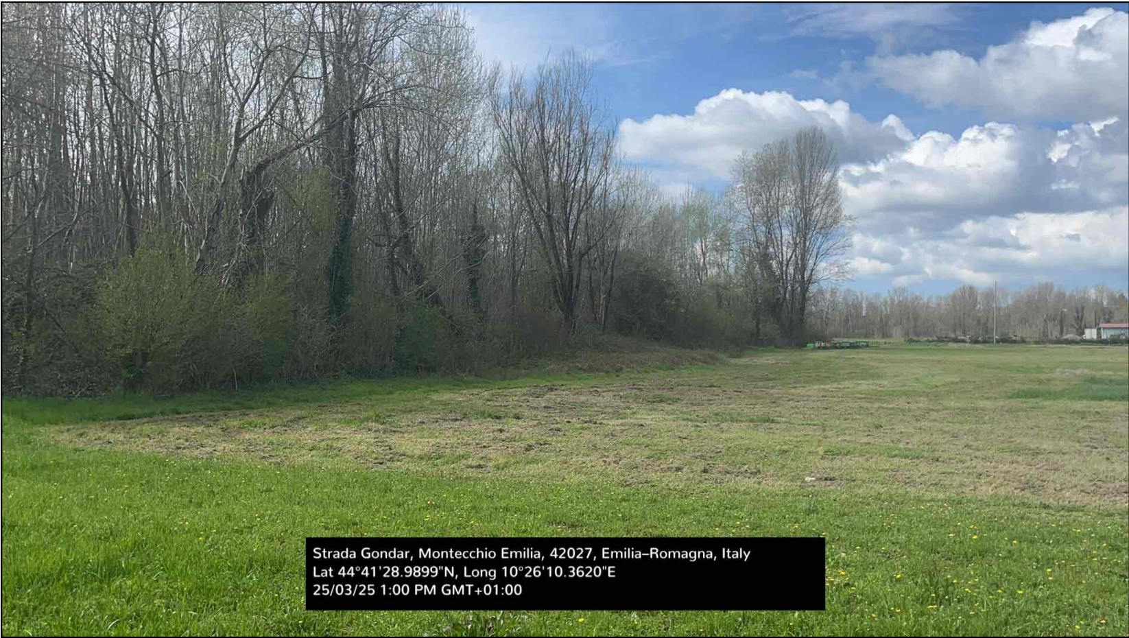
Area a coltivo

Sintesi geomorfologica [*]: Ghiaie in affioramento