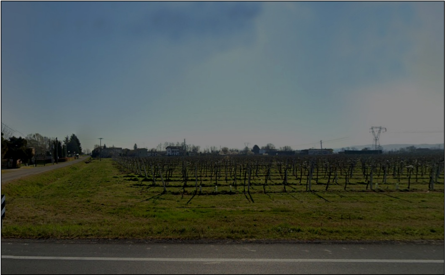
Area ad uso vigneto

Sintesi geomorfologica [*]: Depositi limo-argillosi