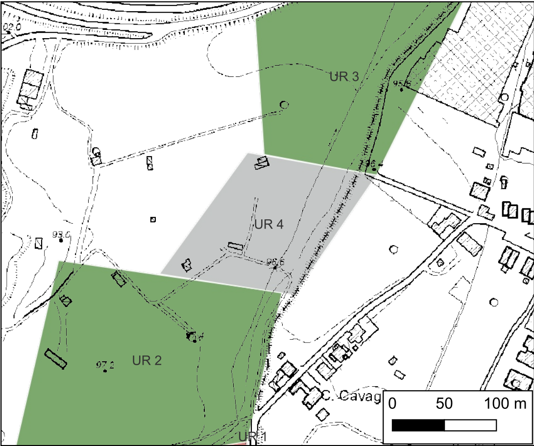
Orti privati inaccessibili