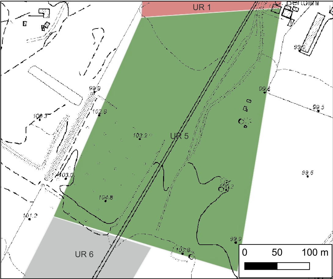
Area a coltivo