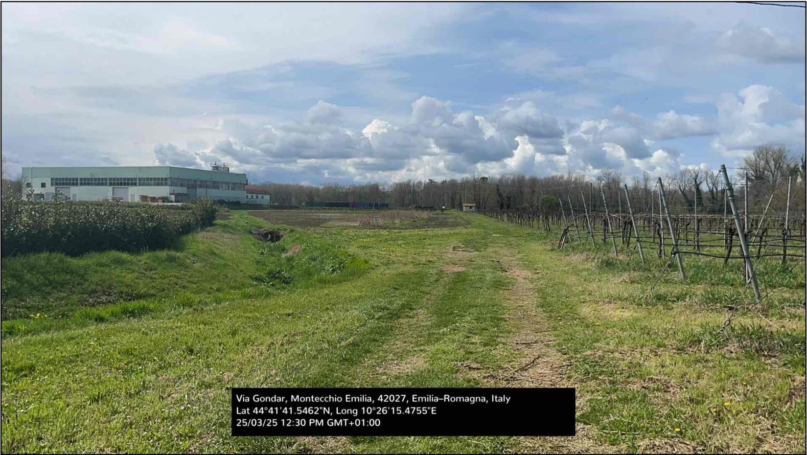
Coltivazione a vigneto

Sintesi geomorfologica [*]: depositi argillo-limosi