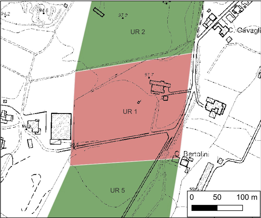
Campi arati nell'area di via Gondar