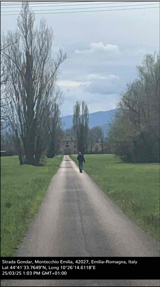
Area in proprietà privata non accessibile

Sintesi geomorfologica [*]: Ghiaie in affioramento