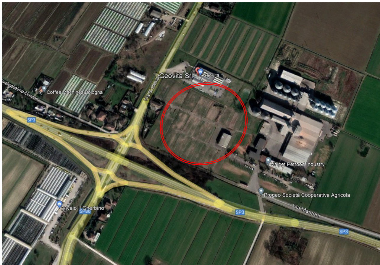
Fig. 1 – Inquadramento territoriale dell'intervento