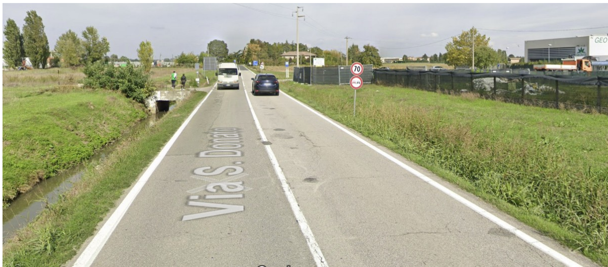
Figura 4 – Foto dell'area dalla via San Donato.