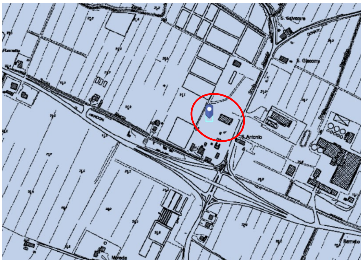
Figura 2 – Stralcio planimetrico del rischio di alluvione dato dal reticolo principale

Di seguito si riportano gli stralci planimetrici delle carte del PGRA da cui si evince quanto indicato sopra.