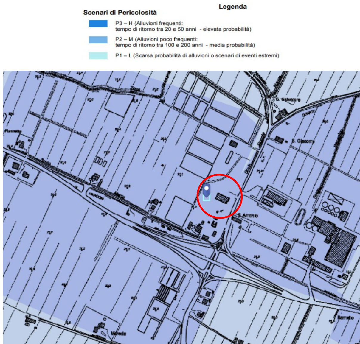
Figura 3 – Stralcio planimetrico del rischio di alluvione dato dal reticolo secondario di pianura (indicato con cerchio rosso la zona in cui si inserisce l'area di intervento)

(indicato con cerchio rosso la zona in cui si inserisce l'area di intervento)