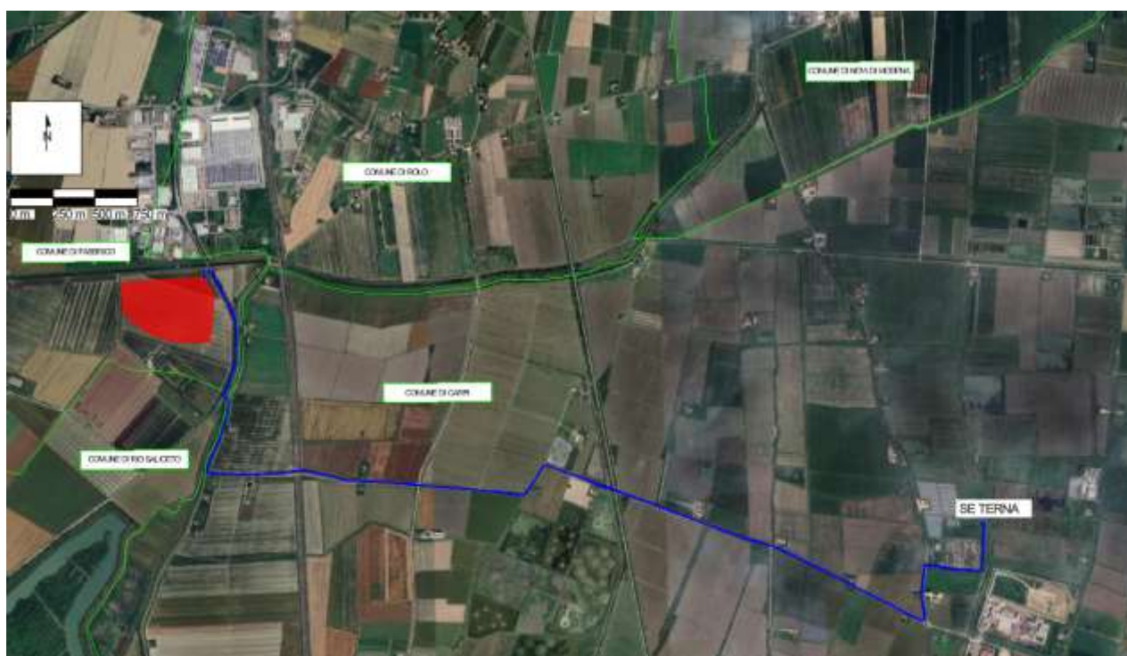
Figura 2: Area di impianto (in rosso) e del tracciato del cavidotto di connessione alla rete (in blu)

Di seguito il tracciato dei cavidotti in progetto (cfr. elaborato "FAB.ENG.TAV.006_Planimetria cavidotti impianto"):