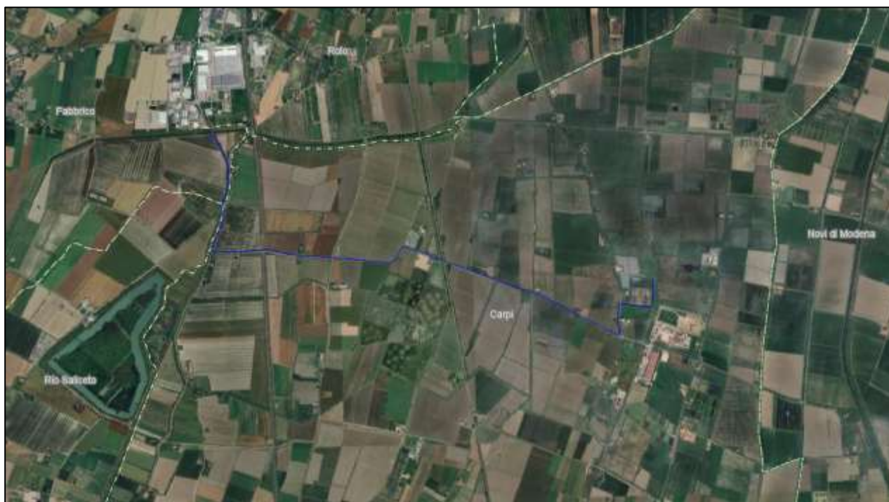
Figura 1 - Sovrapposizione su ortofoto del tracciato del cavidotto di connessione alla rete (in blu) per il quale si richiede variante

Il cavidotto di progetto, oggetto di interesse del seguente studio, si sviluppa per circa 827 m sul territorio del Comune di Fabbrico (RE), per circa 73 m sul territorio del comune di Rio Saliceto (RE) e per 5,9 km sul territorio del comune di Carpi. La variante in esame prevede modifica cartografica al PRG di Rio Saliceto in seguito alla realizzazione di un elettrodotto di media tensione realizzato per il trasferimento alla rete elettrica della energia prodotta da un impianto fotovoltaico di nuova costruzione di potenza nominale pari a 16.806,24 kWp.