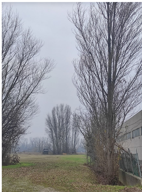
Foto 4. Area interna al lotto in cui verrà realizzata la tettoia