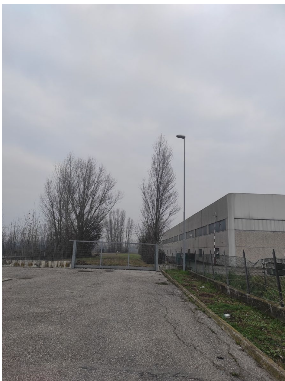
Foto 1. Strada di accesso al lotto con cancello metallico esistente