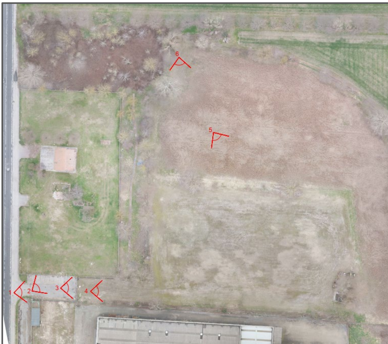
ORTOMOSAICO CON PUNTI DI RIPRESA