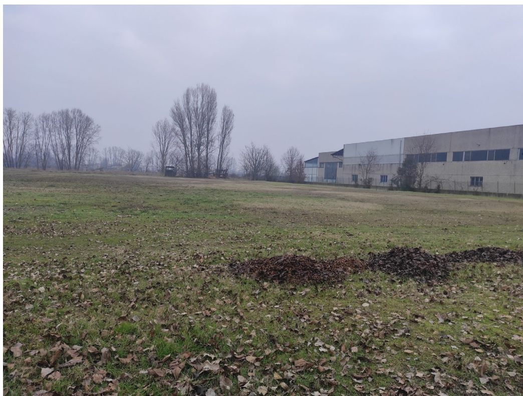
Foto 5. Area interna al lotto zona sud- ovest