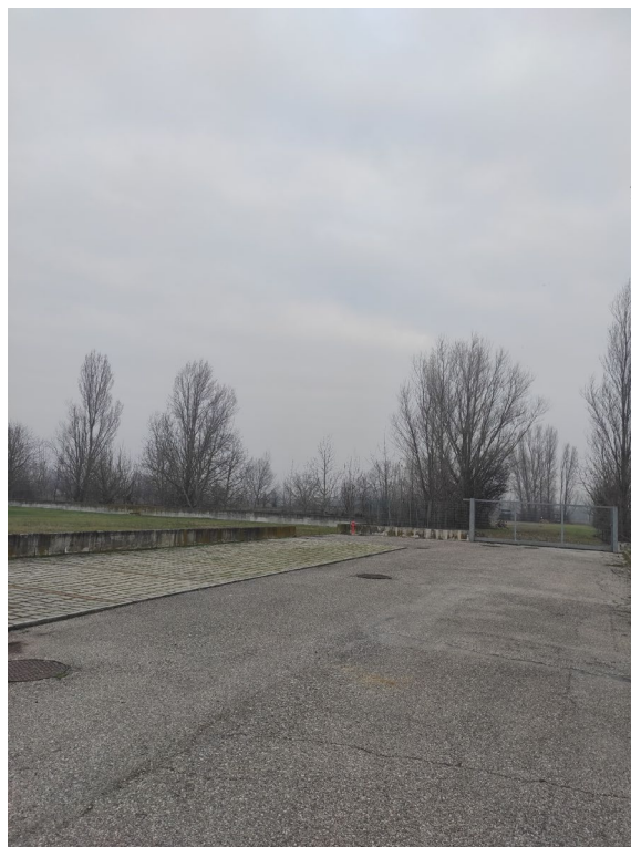
Foto 2. Parcheggi adiacenti alla strada di accesso al lotto