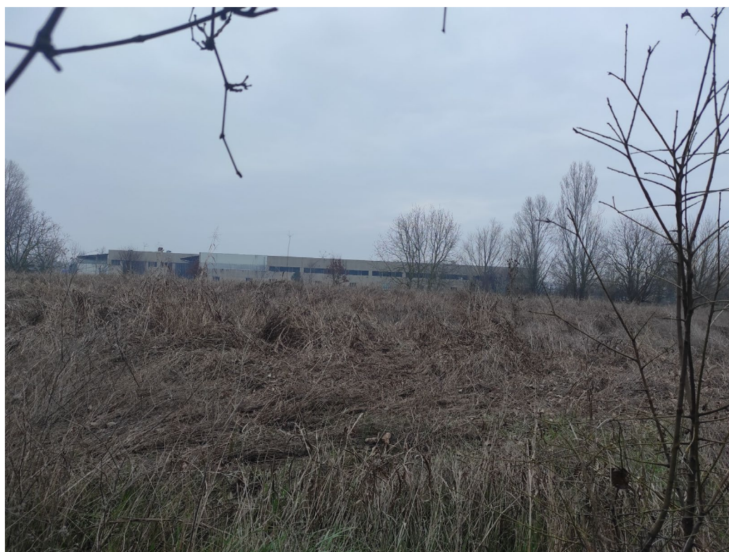
Foto 6. Area interna al lotto zona ovest