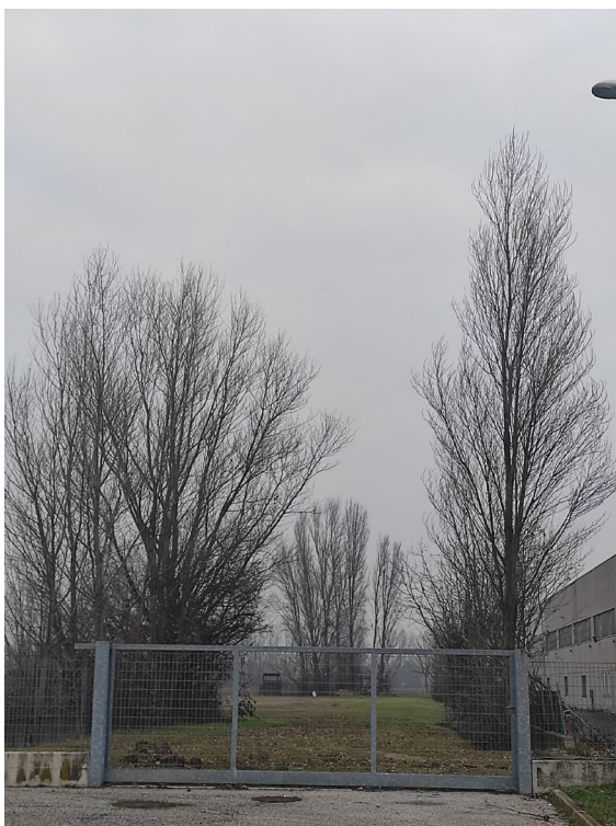
Foto 3. Cannello di ingresso al lotto