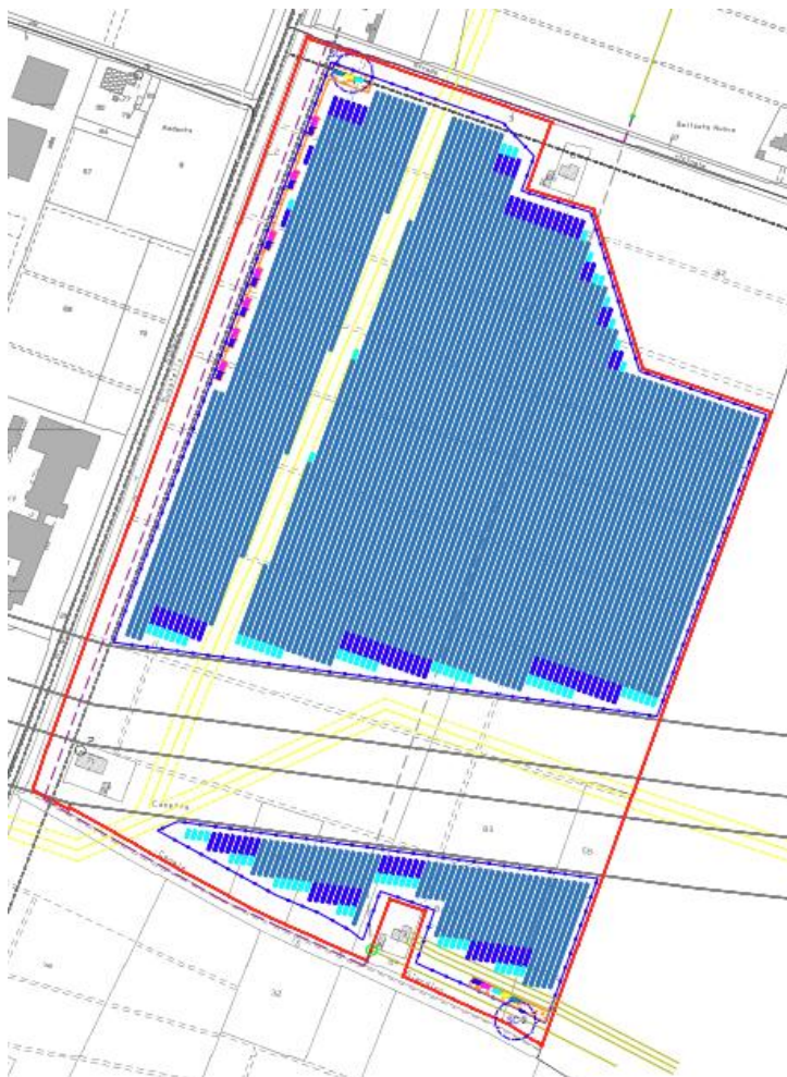
Figura 3.1: Inquadramento catastale

Il progetto in esame è ubicato nel comune di Novi di Modena, in provincia di Modena (MO). In Figura 3.1 nell'inquadramento catastale impianto viene evidenziato in rosso l'area totale dell'impianto agrivoltaico di progetto. Il cavidotto di connessione che collega l'impianto agrivoltaico alla nuova stazione elettrica (SE) si estende per circa 8,9 km, sarà interrato e percorrerà unicamente la pubblica via. Di seguito viene mostrata l'inquadramento catastale del sito: