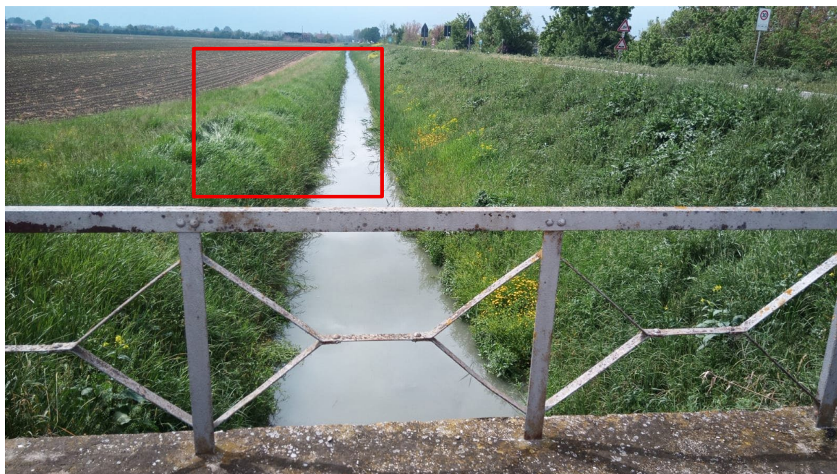
Figura 1.3: Area di scarico nel fosso Busatello, in rosso l'area d'interesse

Inoltre, si riportano di seguito una fotografia dell'area di scarico nel fosso Busatello, quale integrazione descrittiva dello stato dei luoghi.