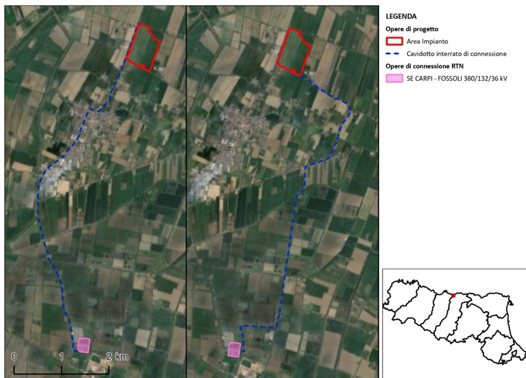
Figura 1: Confronto fra la prima e la seconda configurazione