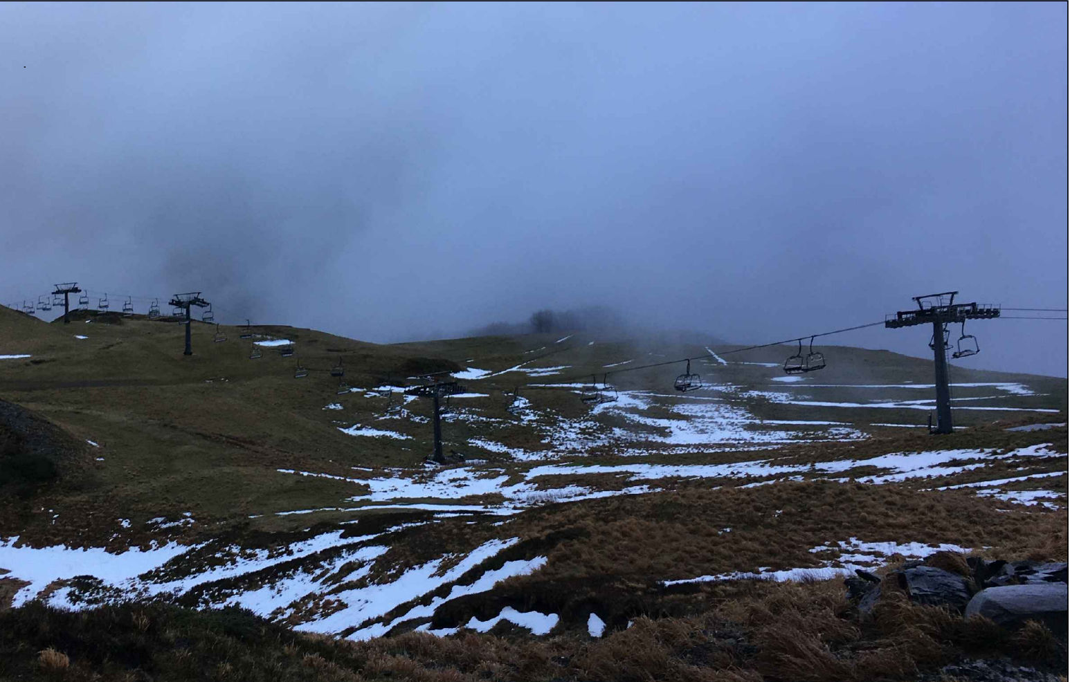
FOTO 10 - Seggiovia Direttissima - Linea e Sostegni