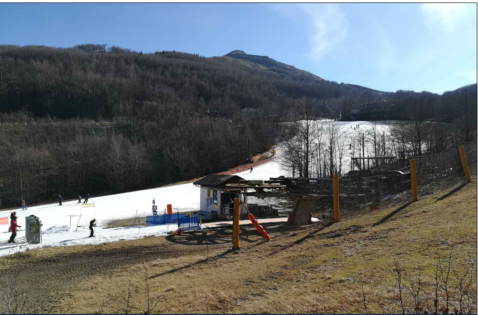
FOTO 6 - Seggiovia Direttissima - Stazione di Valle