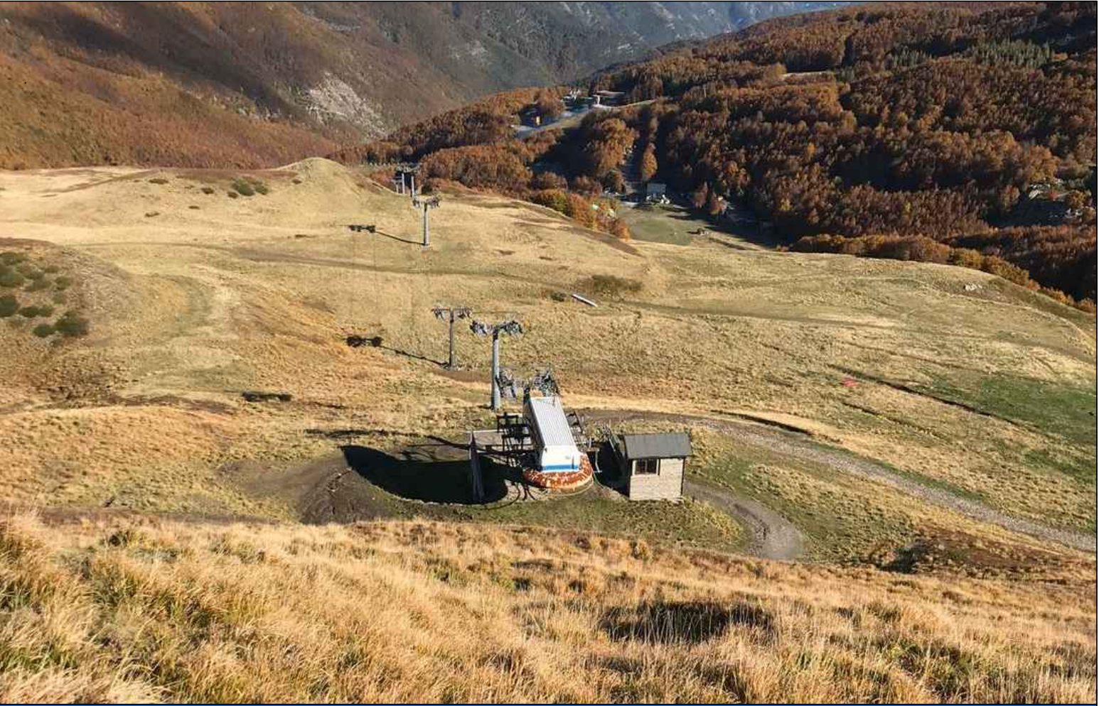
FOTO 8 - Seggiovia Direttissima - Stazione di Monte