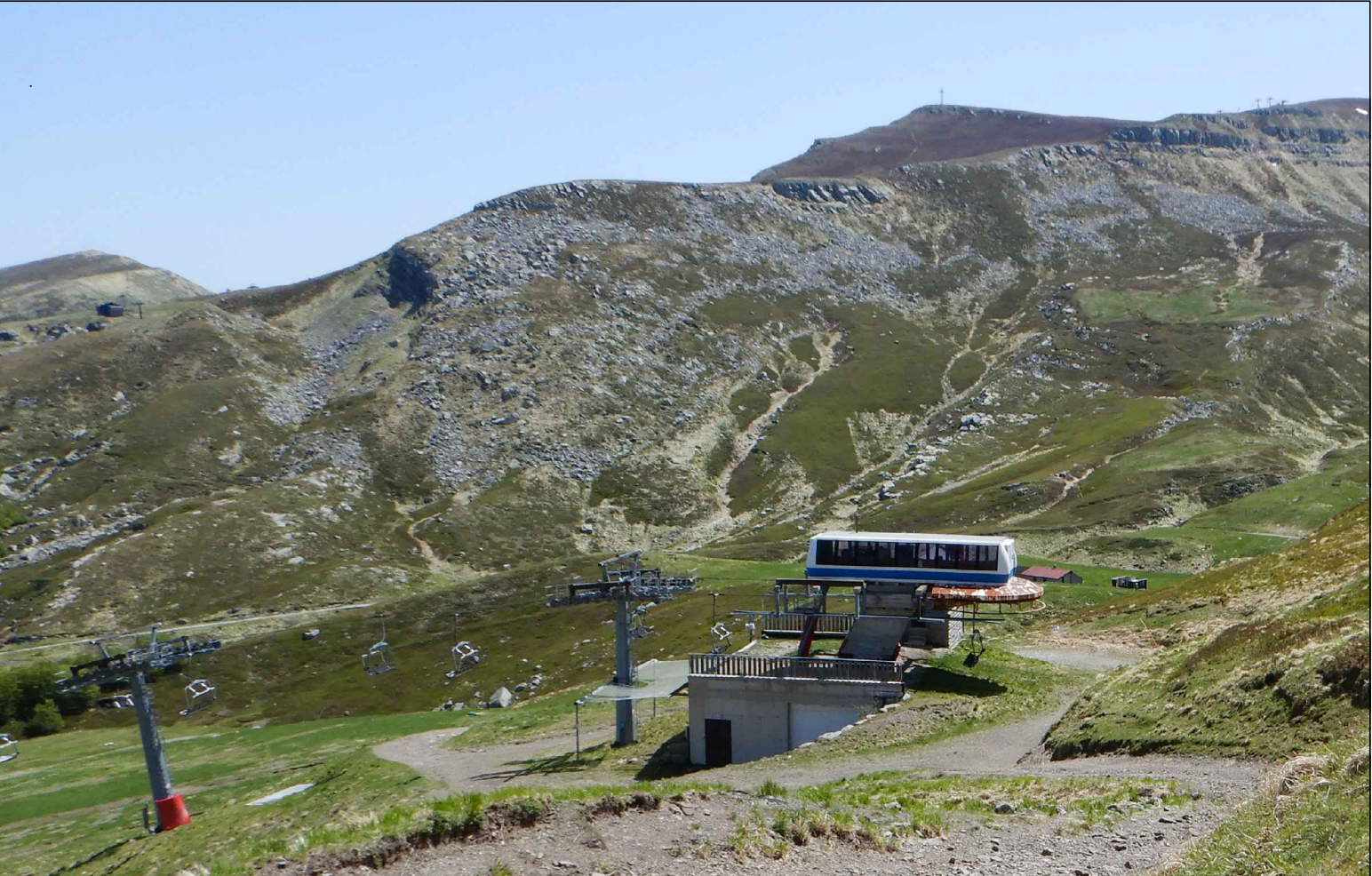
FOTO 9 - Seggiovia Direttissima - Stazione di Monte