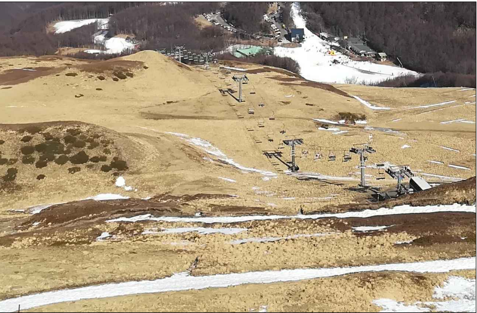
FOTO 12 - Seggiovia Direttissima - Linea e Sostegni