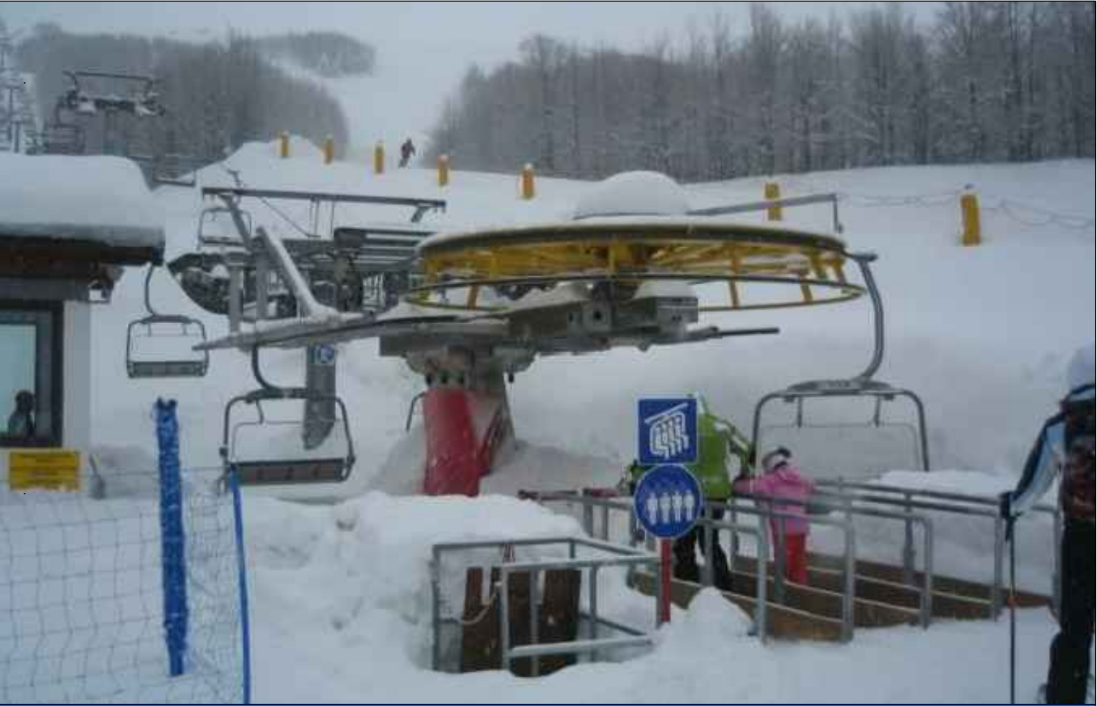
FOTO 7 - Seggiovia Direttissima - Stazione di Valle