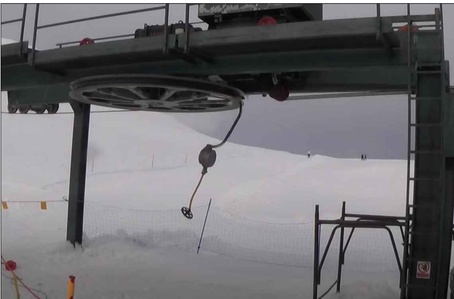
FOTO 1 - Sciovia Cupolino - Stazione di Valle