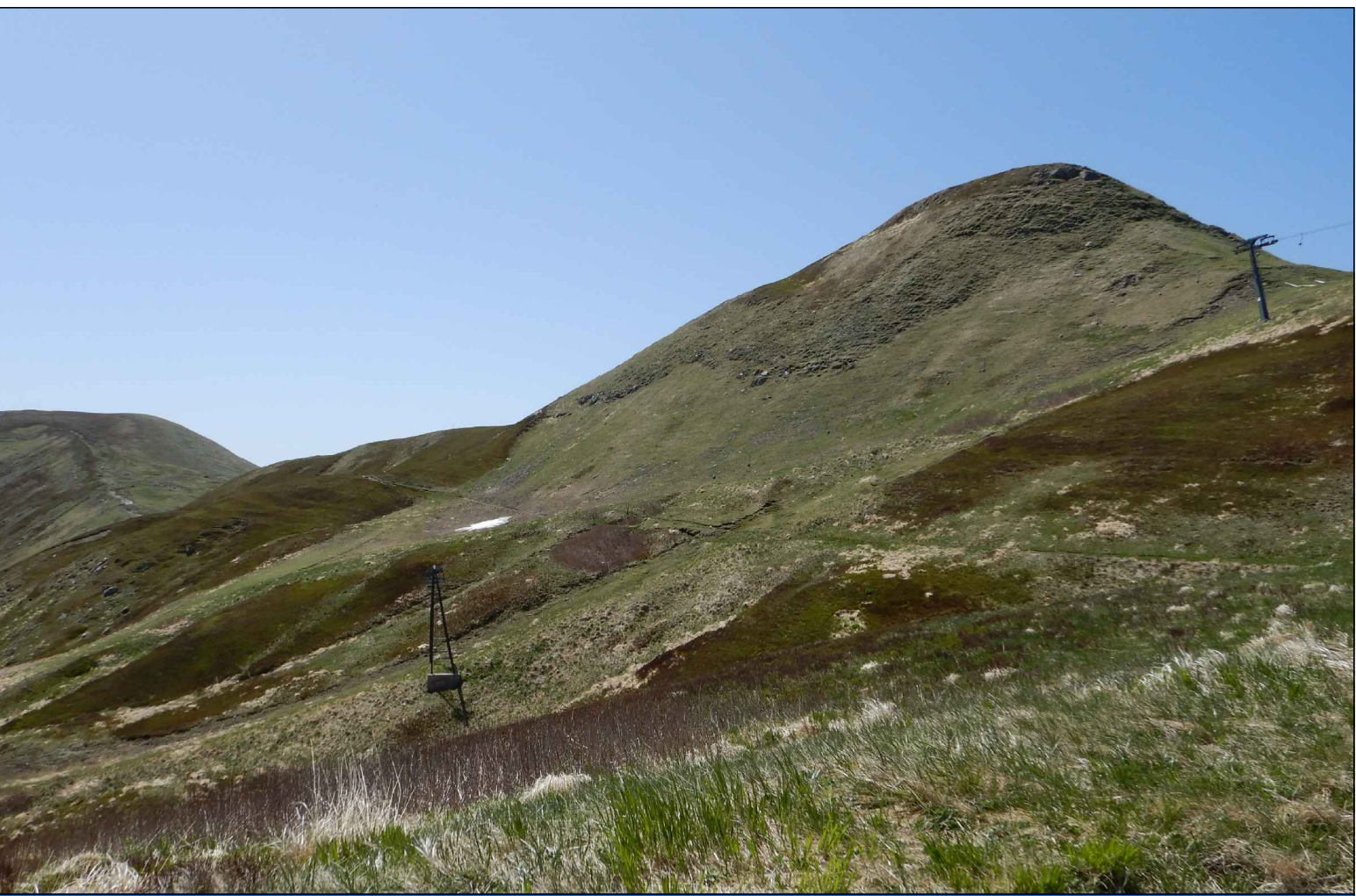
FOTO 5 - Sciovia Cupolino - Linea e Sostegni