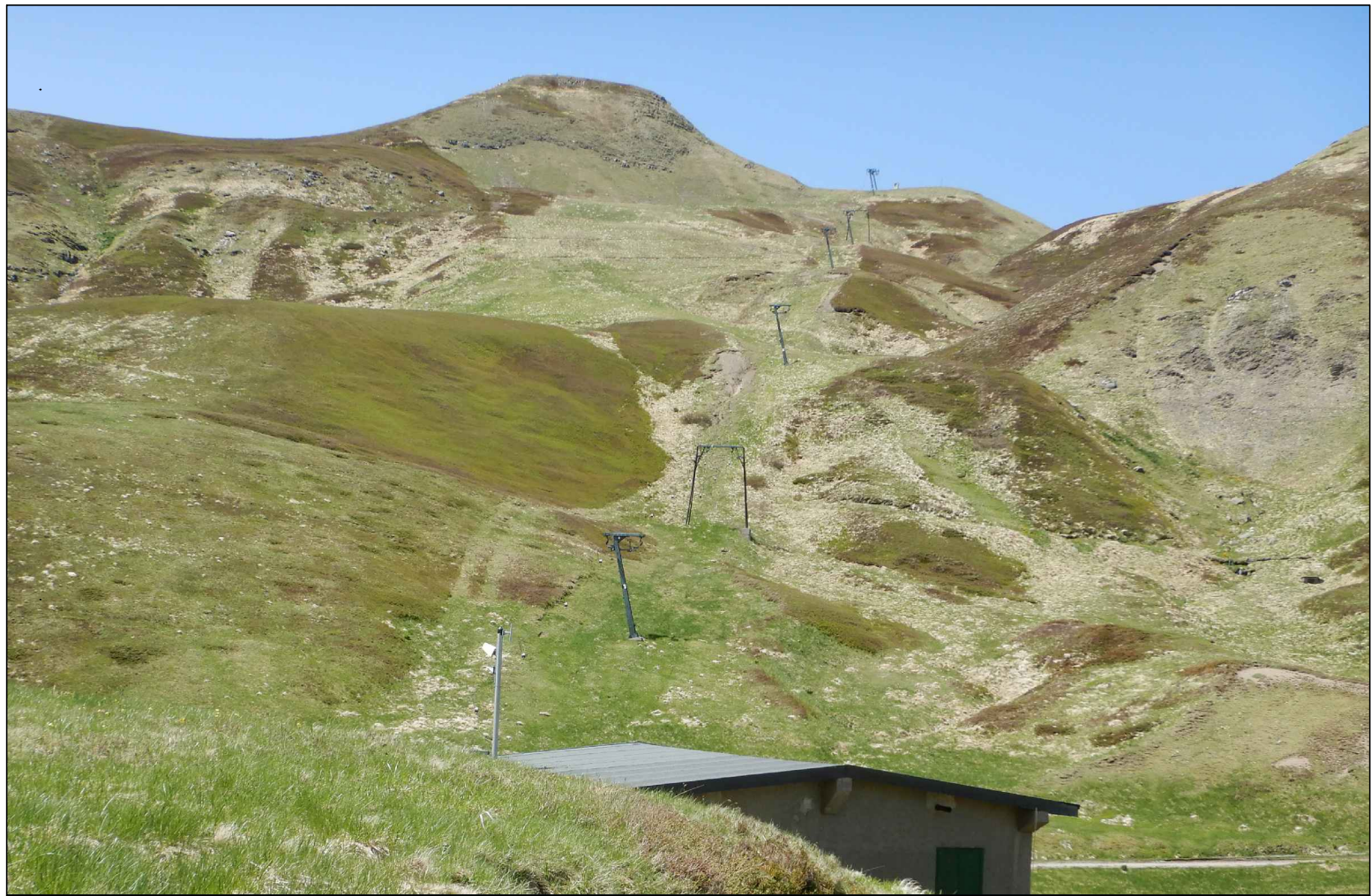
FOTO 4 - Sciovia Cupolino - Linea e Sostegni