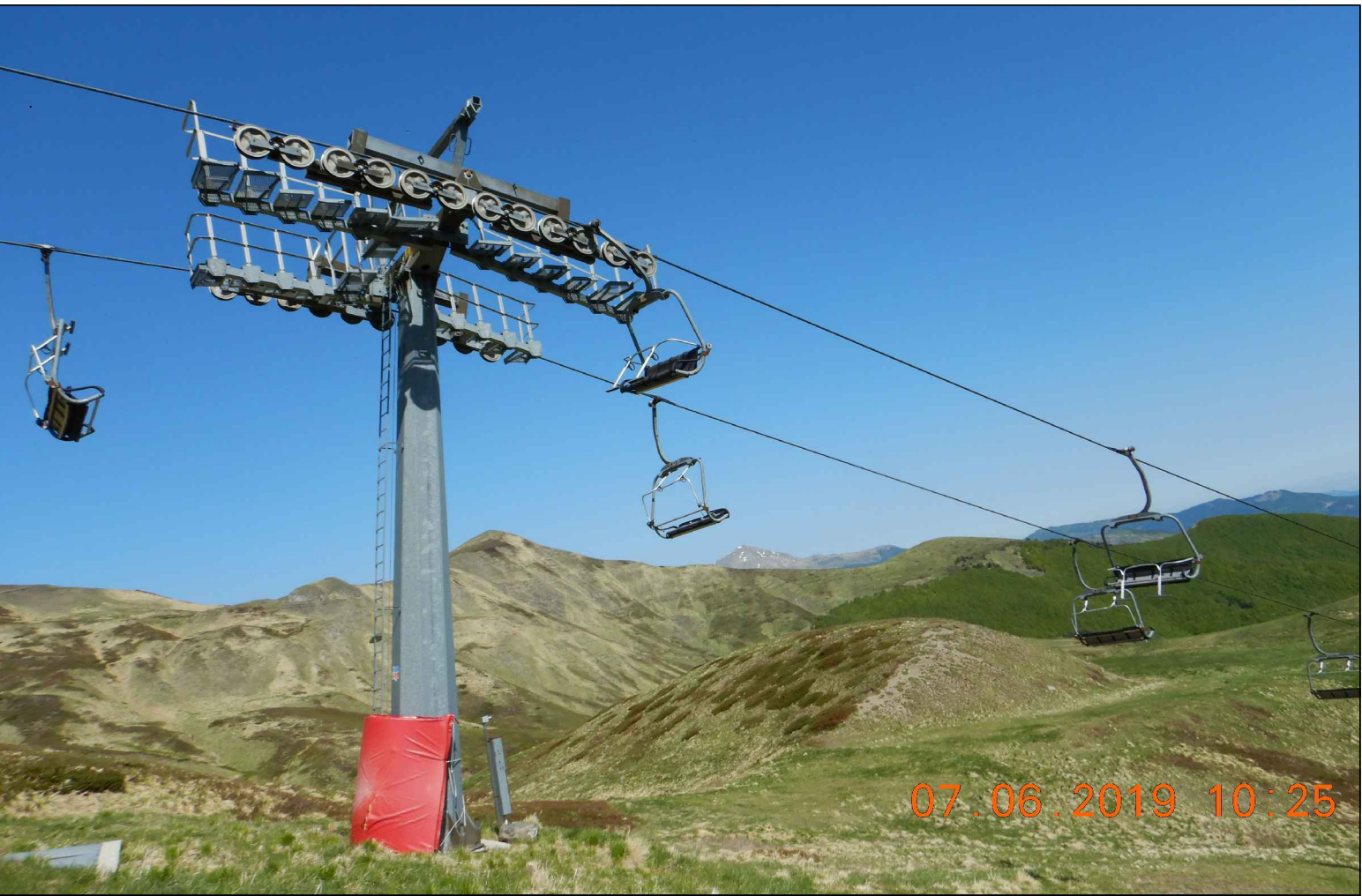
FOTO 11 - Seggiovia Direttissima - Linea e Sostegni