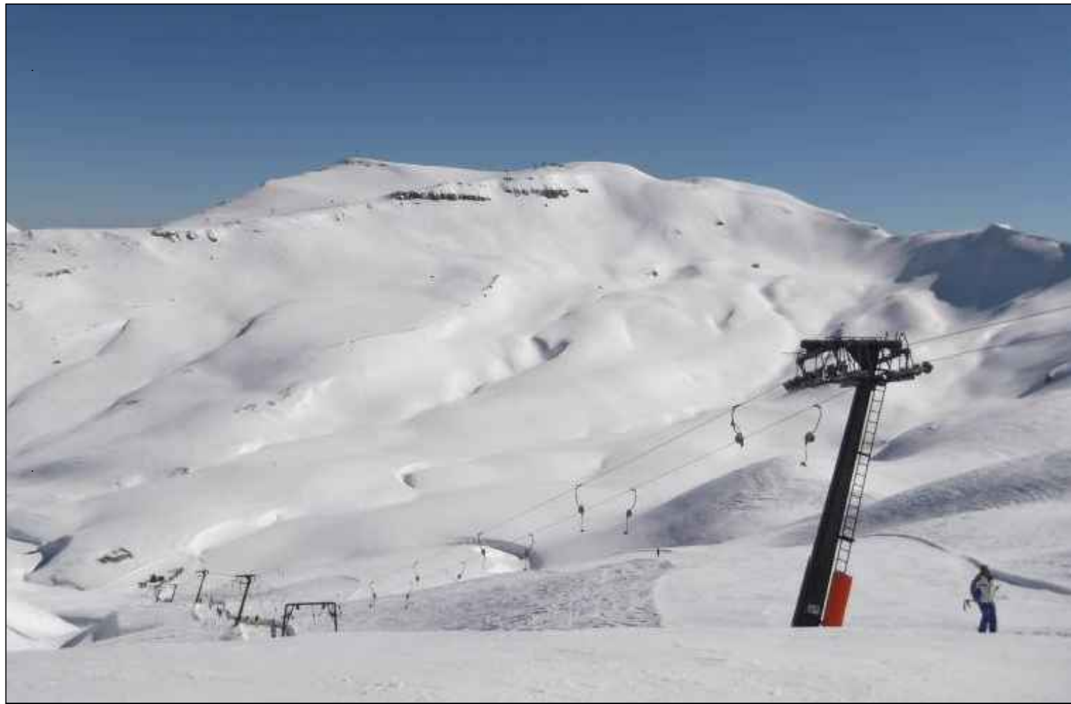
FOTO 3 - Sciovia Cupolino - Linea e Sostegni