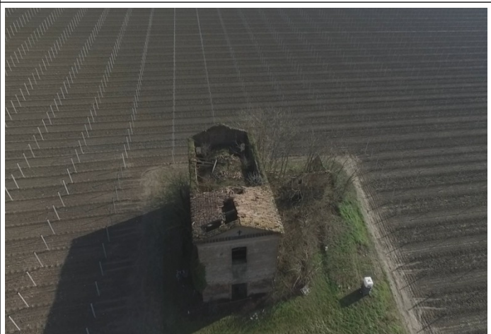
Vista aerea chiesa di Santa Croce da cui si vede l'assenza del tetto

Si riporta infine l'immagine con l'indicazione della fascia di rispetto di 1 km: