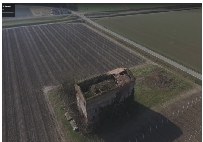
Vista Chiesa di Santa Croce