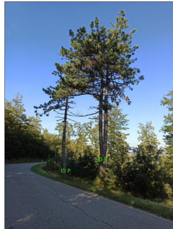
FOTO N.2 - ID P: Pinus nigra, diametro 32 cm (a sinistra) e Pinus nigra, diametro 40 cm (a destra)