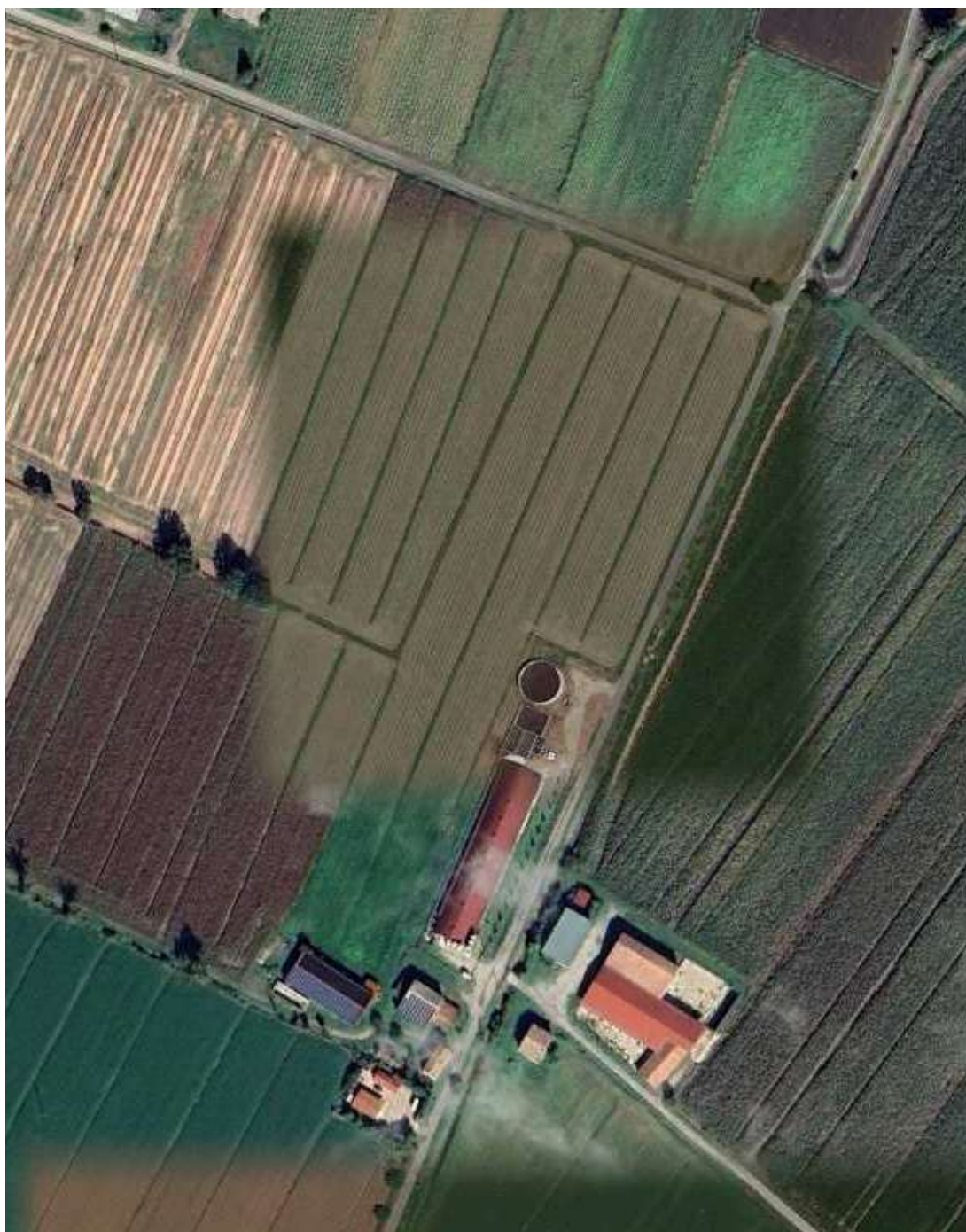
Ortofoto – area oggetto di intervento