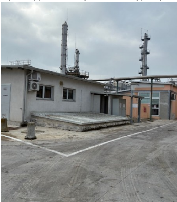
FIG.PARTICOLARE FABBRICATI ED APPARECCHIATURE ESISTENTI

INSERENDOSI IN UN'AREA GIA' DOTATA DI SERVIZI (SOTTOSERVIZI, APPARECCHIATURE FUNZIONALI AL SITO ECC..) NON ALTERERA' ASPETTO ARCHITETTONICO COMPLESSIVO.