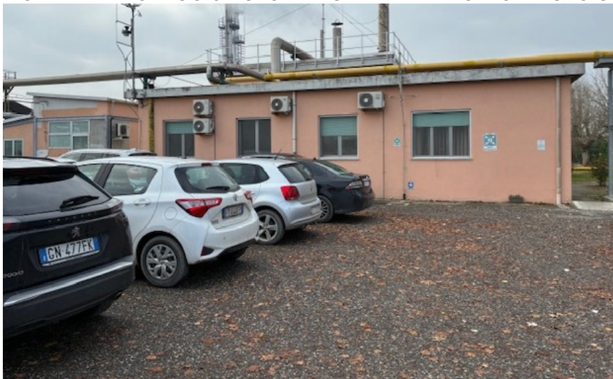
FIG.AREA PARCHEGGIO AUTOVETTURE E FABBRICATO AD USO UFFICI.

LE TINTEGGIATURE DEI FABBRICATI AD USO SALA CONTROLLO E MAGAZZINO SI UNIFORMERANNO AI FABBRICATI ESISTENTI, ALL'INTERNO DEL SITO PRODUTTIVO.