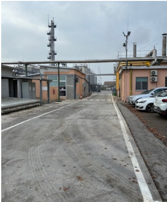
FIG.PAVIMENTAZIONI ESTERNE IN CLS VIBRATO.

L'AREA DI PARCHEGGIO RISULTA ESSERE IN MATERIALE BITUMINOSO.