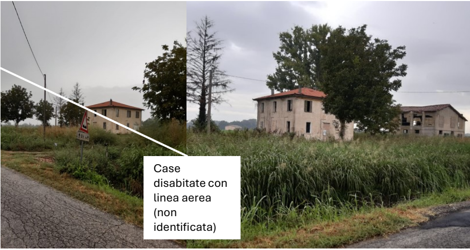
Case disabitate con linea aerea (non identificata)