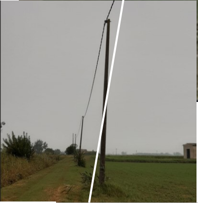
Punto B fosso