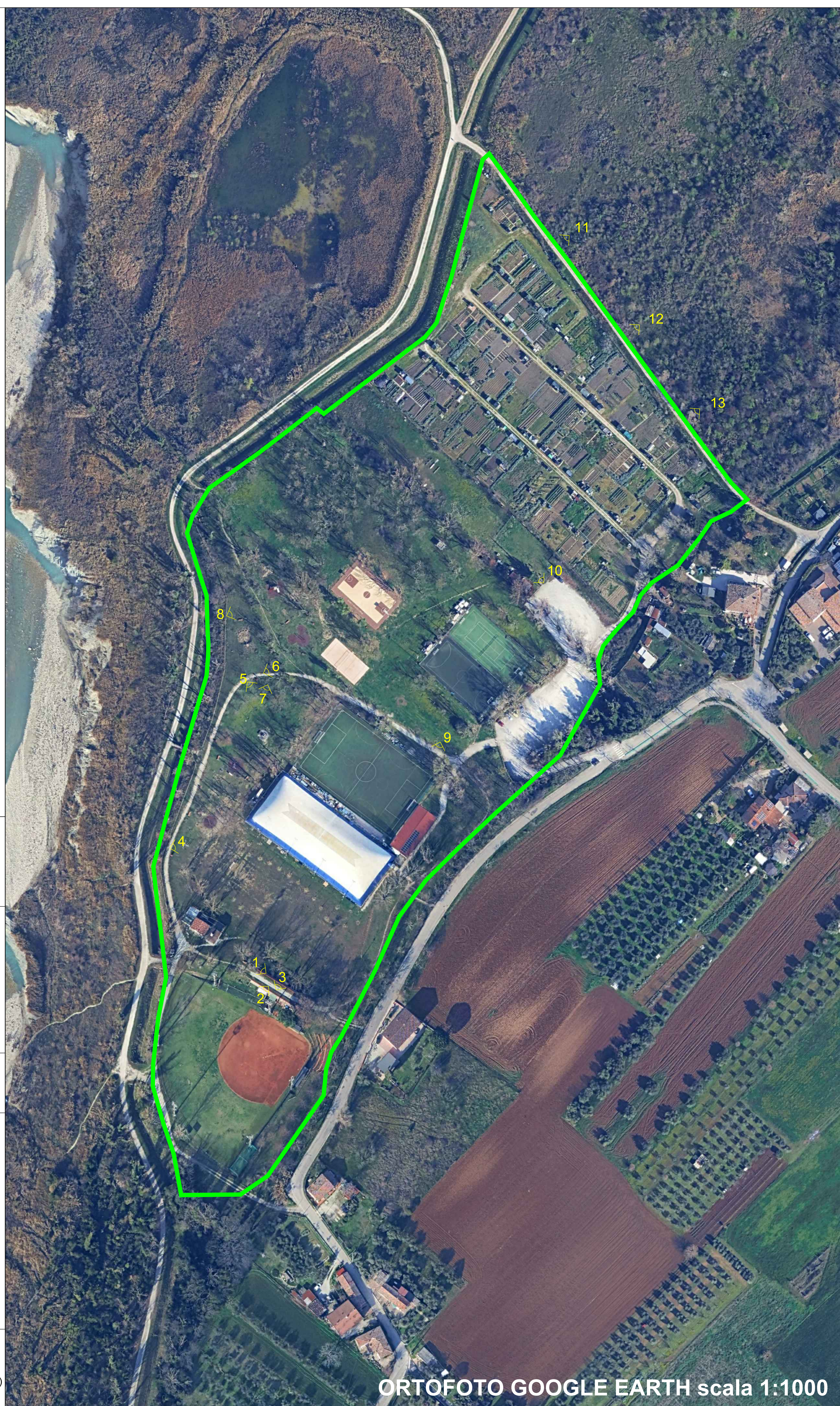
ORTOFOTO GOOGLE EARTH scala 1:1000